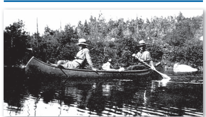
Un guide w8banaki et un client du Club Shooner à Doheny, vers 1930.

En œuvrant au sein des clubs privés de la Mauricie, les W8banakiak entretiennent une forme de mobilité à l'intérieur d'un espace que la Nation arpente depuis les débuts de la colonisation. Forcément, l'apparition de ces clubs n'est pas étrangère à la privatisation des territoires de chasse de la Mauricie fréquentés par les W8banakiak. Malgré les difficultés associées aux effets de la privatisation, il demeure que les W8banakiak ont perpétué leur mobilité grâce à un accès à la forêt qui résulte en partie du métier de guide.