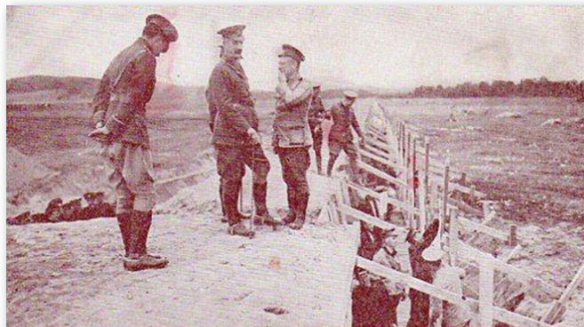
INSPECTION DE LA RANGEE DE 1500 CIRLES AU CAMP DE VALCARTIER, QUEBEC. Un des tributs du Canada à l'Angleterre et à la France. M. N. C. 4.

À leur arrivée au Port de Québec, les militaires marcheurs ont été chaleureusement applaudis par la foule présente avant de monter à bord du destroyer NCSM ATHABASKAN et du navire américain USS OAK HILL, tous deux à Québec dans le cadre du Rendez-vous naval pour une brève cérémonie lors de laquelle tous les marcheurs se sont vu remettre le jeton (un coin) du marcheur en guise de félicitations pour leur participation à cette marche. Pour cette occasion rare et unique, les trois composantes des Forces Armées canadiennes ont été réunies un bref instant lorsque deux avions CF-18 de la Base de Bagotville ont effectué un passage remarqué au-dessus des deux navires amarrés au pied du majestueux Château Frontenac.