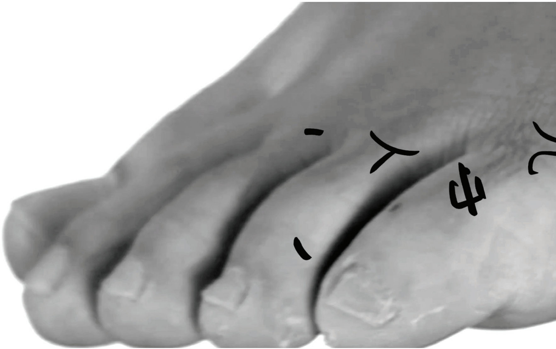
Hung Keung, Écran du scénario de Dao Gives Birth to One (version III), Hong Kong, 2010. Douze écrans vidéo présentant douze temps de projection différents.

cée en face d'un immense disque d'aluminium servant d'écran à une projection vidéo. Les vibrations, le son et la lumière transportent les spectateurs dans une autre dimension, créant une illusion d'apesanteur. L'expérience est spectaculaire. Selon la commissaire Kathleen Forde, la nouvelle génération d'artistes répond à la surcharge sensorielle de notre société moderne en utilisant la technologie d'une manière « qui rehausse notre perception de la perception elle-même 7 . » Félicie d'Estienne d'Orves, elle, utilise les « données scientifiques comme outil de composition » et nous présente ce qu'elle appelle un « noyau » de l'univers 8 .