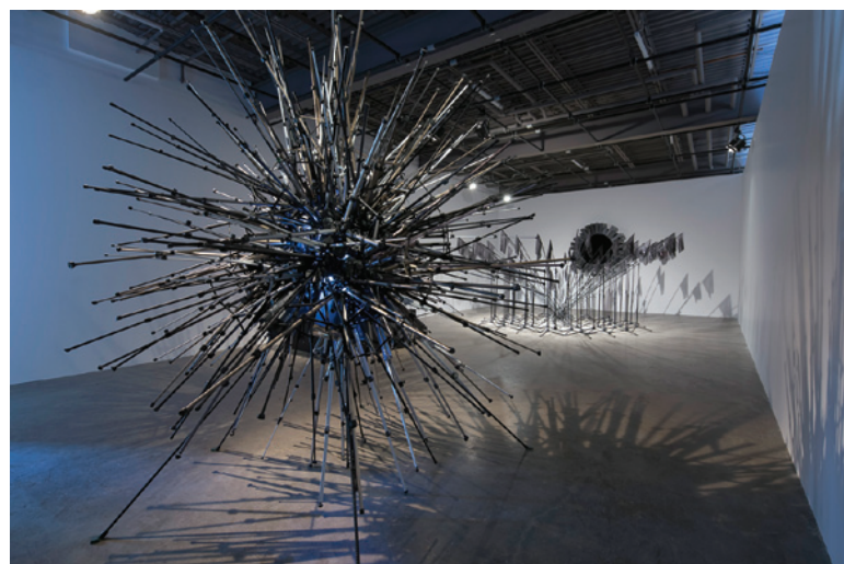
Michael A. Robinson, Subject to Scrutiny , 2015. Appareils photographiques, caméras vidéo, trépieds, fils.