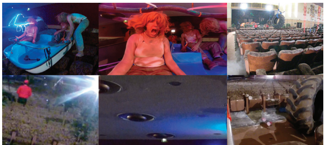
Lizzie Fitch / Ryan Trecartin, Site Visit , 2014. Extraits vidéo. Courtoisie des artistes et de Andrea Rosen Gallery, New York, Regen Projects, Los Angeles, et Spruth, Berlin et Londres.