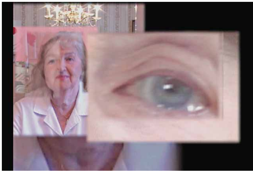
Élaine Frigon, Filiation maman-fillette . Extrait de la vidéo Filiation , 2005.