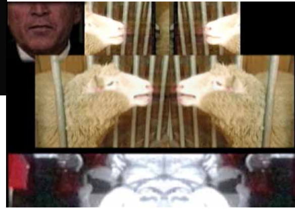
Élaine Frigon, Filiation Dolly . Extrait de la vidéo Filiation , 2005.

Devant ce travail, on perçoit toute l'essence du mot résistance culturelle, riposte formaliste à ce média de masse qu'est la télévision, et particulièrement lorsqu'elle était cantonnée à être diffusée par le meuble lui-même, avant de subir l'implosion par le Web. À la faveur du travail de la vidéaste Élaine Frigon, la tragédie lyrique de l'ange Dolly, née sans défenses, moutonne clonée, la première de son espèce, puis morte soudainement après un vieillissement prématuré, se déploie sous nos rires d'angoissé(e)s par la technologie folle.