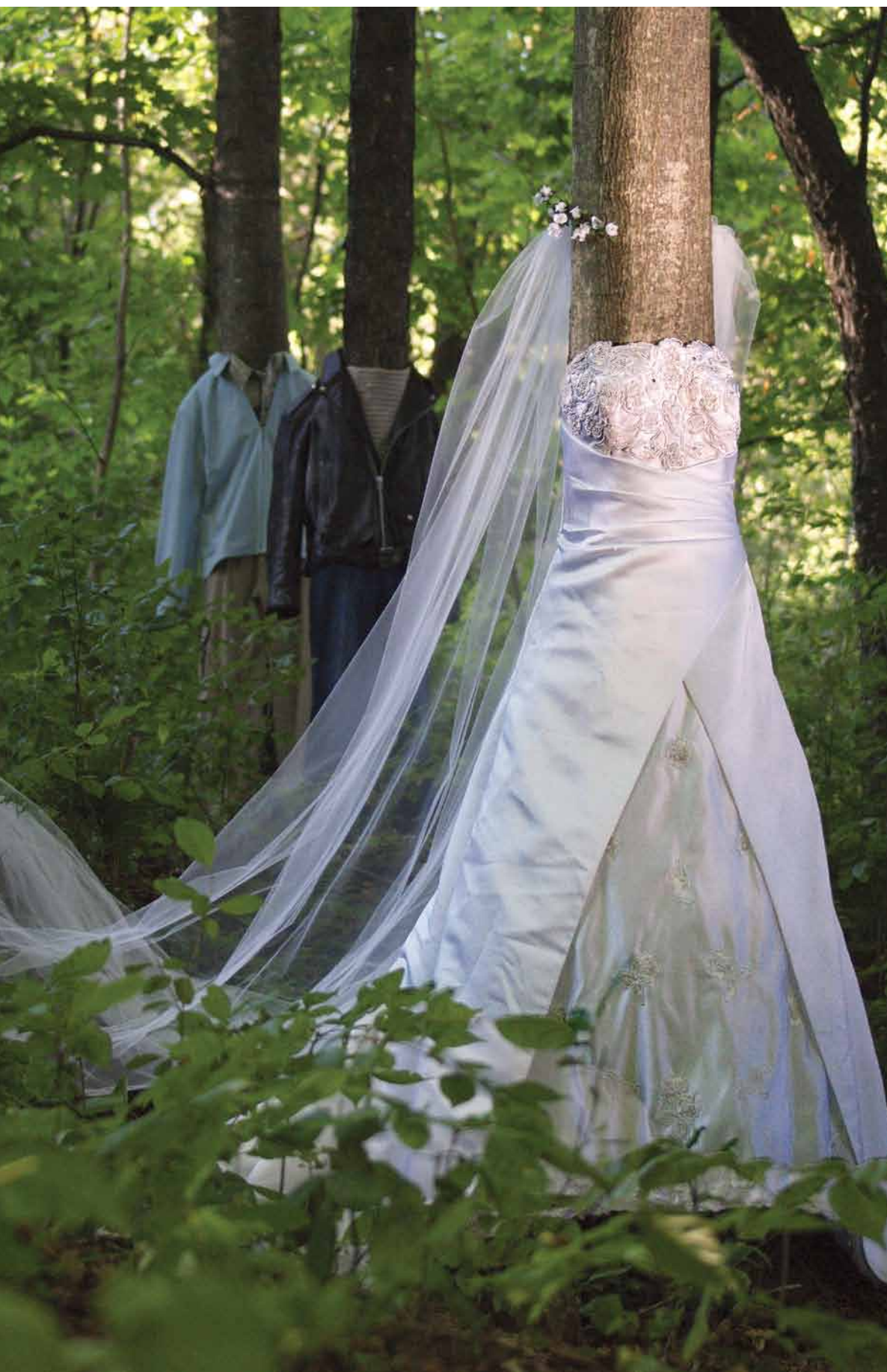
Élaine Frigon, Poursuite . Série De la série La Mariée et ses célibataires même . Impression numérique, 2013.

ment formel ou conceptuel. La première chose que j'ai faite a été de demander à mes frères et sœurs, autres membres de la famille, la permission de diffuser leur image dans ces archives. Certain(e)s ont accepté, d'autres ont refusé. J'ai donc utilisé, comme artiste, les stratagèmes de la censure en floutant ou en apposant des filtres sur les images.