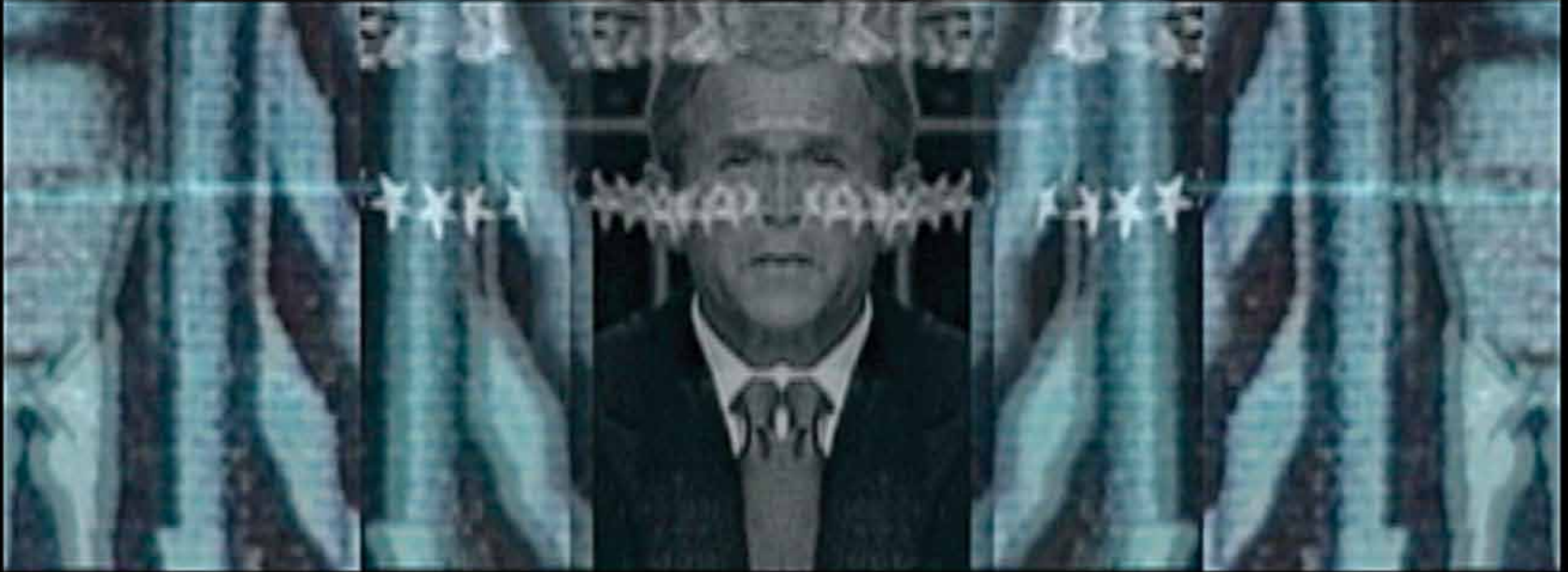
Élaine Frigon, Filiation Bush père-fils . Extrait de la vidéo Filiation , 2005. Photo : Élaine Frigon.