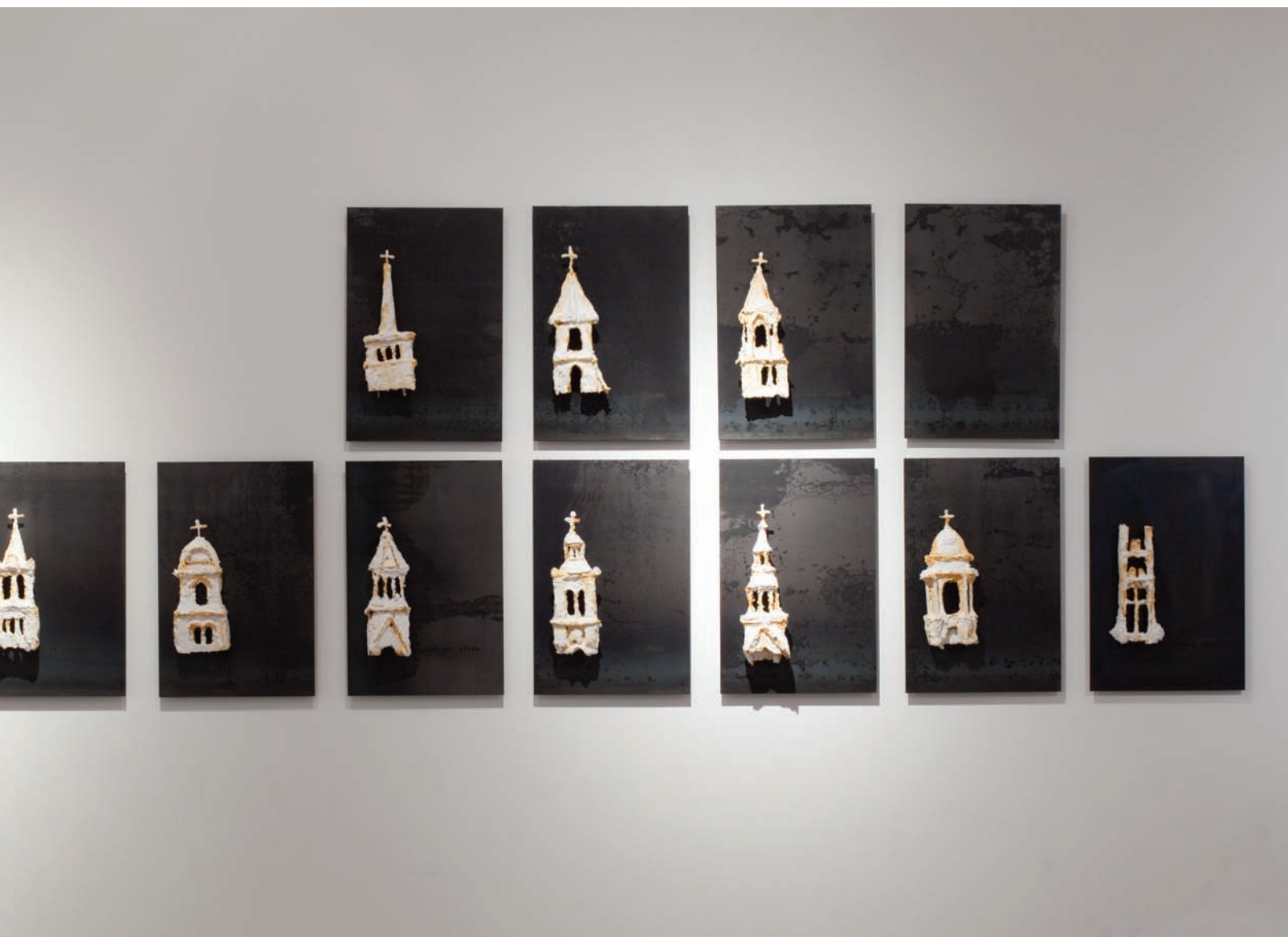
Pierre Leblanc, Signes et repères , 12 plaques des églises, 2011. Acier et plâtre, et texte de messe en latin.

à renouveler la valeur patrimoniale des églises et à l'investir d'une symbolique autre .