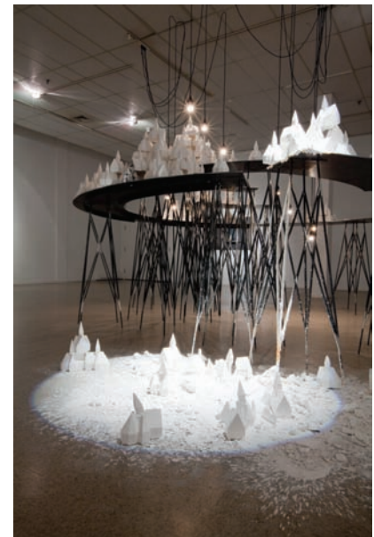
Pierre Leblanc, Signes et repères, Diable... mais qu'est-ce qu'on fait avec tout ça ! (détail), 2011. Acier, plâtre, plastique, électricité, lumières.