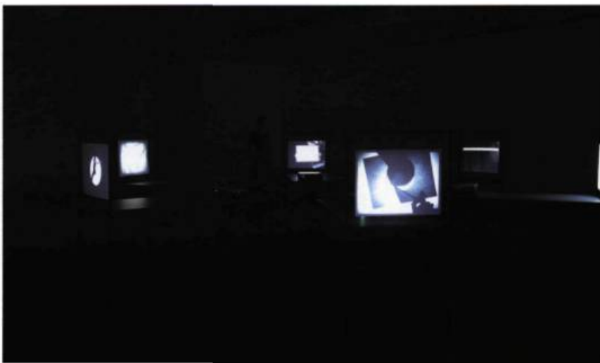
Manon De Pauw, Répertoire 1 , 2009. Installation vidéographique à 6 projections en boucle avec son, tables en bois et métal, plexiglas et matériaux divers.

Il en va un peu ici comme si on était passé du corps à l'œuvre dont l'inscription vidéographique vient montrer l'activité, dans une esthétique où les gestes sont à déployer pour être vus et saisis, à un couchage sur papier du geste même. Dans un premier temps, la performance n'est jamais loin. On la sent orbiter aux environs. Ce n'est pas pour rien que c'est là le thème même qui fait l'objet du cours du corps pédagogique. Le corps est à l'œuvre, dans une activité qui n'a rien d'efficace ni ne mène à un objectif concret. Il mani-