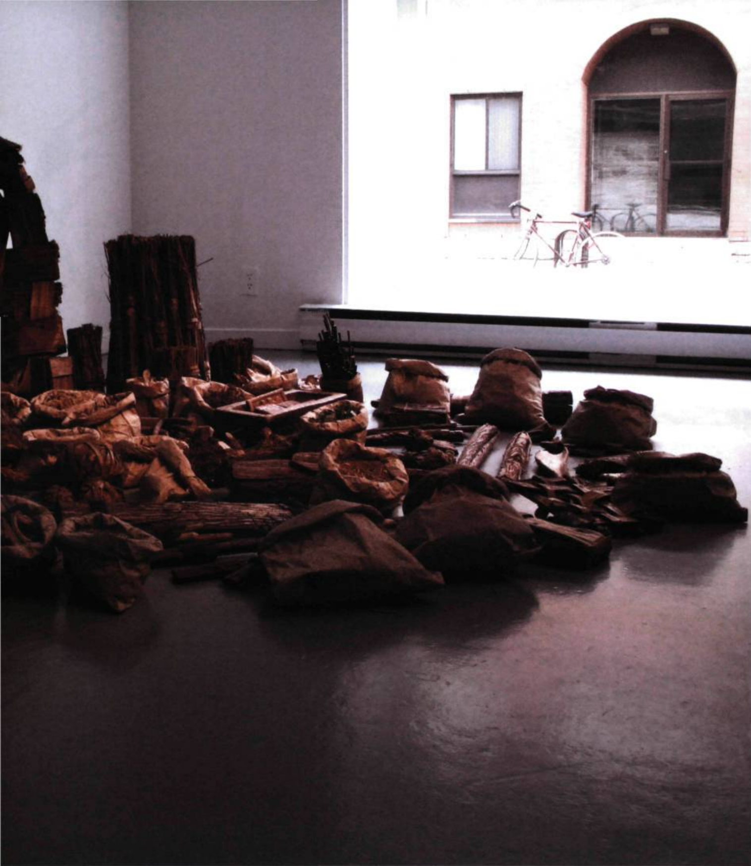
Domingo Cisneros, La reconquête : enfer, purgatoire, paradis (détail : vue de l'enfer) installation, 2008, techniques mixtes, dimensions variables.

installation intitulée La Reconquête (2008); nous y reviendrons. D'autres expérimentations ont mené à la fabrication de produits commerciaux tels que la tisane Annedá , offerte au public à l'occasion des soirées d'ouverture de l'Espace 400, lors du 400 e anniversaire de la ville de Québec (2008), en guise de geste d'hospitalité. Médication traditionnelle autochtone, cette tisane aurait, semble-t-il, protégé Jacques Cartier et ses hommes du scorbut. Conceptuellement, le CREAM s'inscrit dans la continuité du travail qu'avait entrepris Cisneros dans les Laurentides, à la