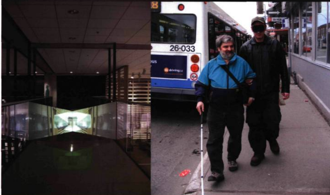
Francisco Lopez, Blind City , 2006. 10 guides aveugles, 4 haut-parleurs et une caméra. Œuvre inédite et insitu.

même un surgissement de l'humanité, anthropophage et génératrice tout à la fois. À partir de ces identités multiples qu'elle forge, elle crée un mythe qui devient une force d'attraction et de répulsion.