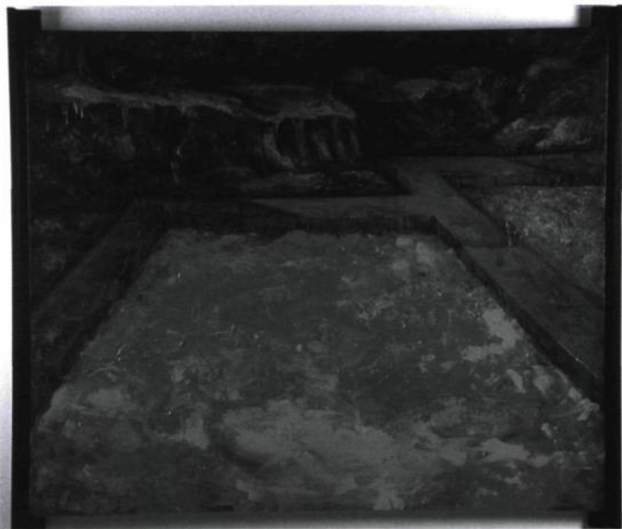
Réal Calder, Vue sur la terre - l'enceinte , 2003 ; 180 x 210 cm.

détourne du réel que seule la forme abstraite peut transcender. C'est de l'apparaître de la (d'une) nature, non de sa ressemblance, dont il est question dans Cadre du monde . Il est surprenant que de tels propos s'appliquent à une peinture fort différente des premières abstractions apparues au début du XX e siècle avec Kandinsky. Néanmoins, leur point commun est une époque associée dans son ensemble à l'anxiété, soit l'avant-guerre de 1914 pour les débuts de l'abstraction; la guerre et les attentats meurtriers, et plus généralement le « Mal » associés au monde actuel. On comprend mieux pourquoi R. Calder avoue tenter de répondre à la suite de M. Heidegger, s'appropriant lui-même le titre d'un poème de Hölderlin, « Pourquoi des poètes en ces temps de détresse ? »