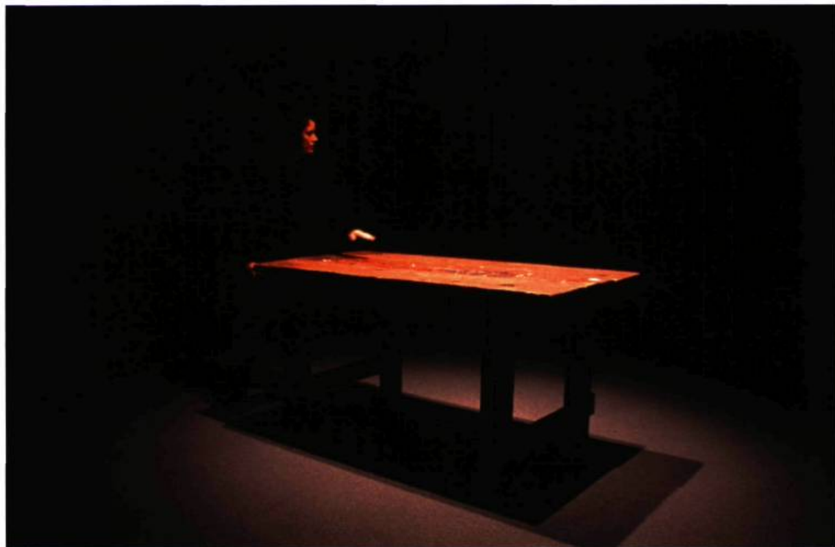
Janet Cardiff, To Touch , 1993. Installation multimédia.

Plusieurs des œuvres de Cardiff convoquent le cinéma. Le langage visuel du cinéma comme le dispositif cinématographique, ou l'« effet cinéma », fournissent à l'artiste tantôt une atmosphère, qui provient le