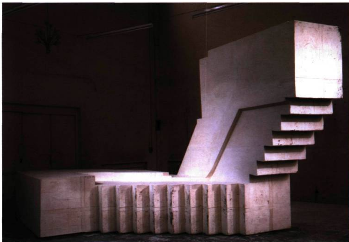
Rachel Whiteread, Untitled (Basement) , 2001. Technique mixte. Deutsche Guggenheim Berlin.

référence la rotonde et la fameuse spirale du musée new-yorkais et en inversa littéralement la proposition. Bien que ce jeu de références inversées soit pour le public berlinois plutôt hermétique 12 , cette confrontation originelle avec l'institution explique notamment la teneur des oppositions latentes dans l'œuvre – telles que celles qui éclatent par exemple dans la confrontation d'un espace architectural privé avec son « pendant » public – et montre bien de quelle matière « réflexive » est faite la sculpture de Whiteread, trop souvent restreinte à son seul aspect « minimaliste ayant du cœur » 13 , et s'inscrit dans une pratique radicalement contemporaine – plurielle et politique – de l'art comme « acte de résistance. » 14 Elle procède ainsi par excès, inversions, dialectiques : celles du vide et du plein, de la présence et de l'absence, du positif et du négatif, de la forme et du contenu, du privé et du public, du formel et de l'émotionnel, de l'art et du politique, ou encore de la mémoire et de l'oubli, et introduit dans le corps même de la sculpture un mouvement de contradiction, d'émotion, de résistance par frottements, par contacts, qui la rend inéluctablement critique.