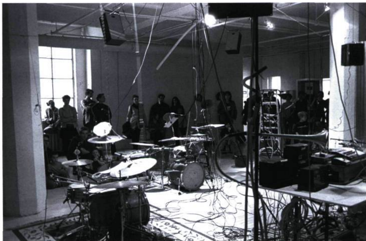
Déphasage , 1999. Duo Travagliando. Skol, Montréal.