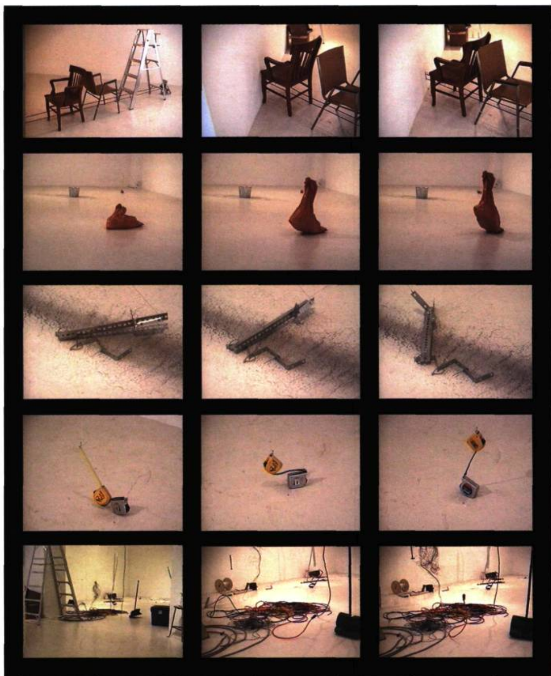
Remue-ménage: glissements et effondrements, 2000. Galerie B-312, Montréal. (Montage vidéo).