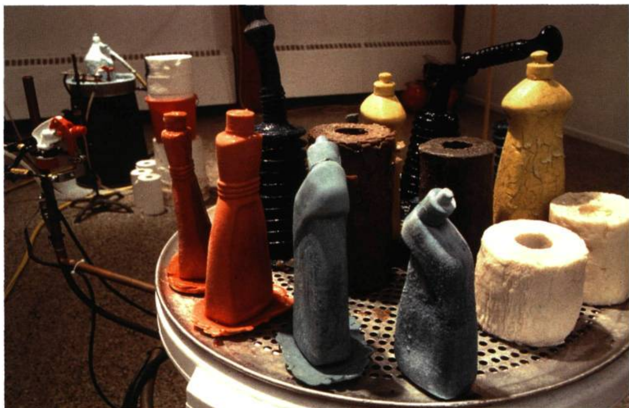
Le grand ménage , 1998. Galerie Le lobe, Chicoutimi.