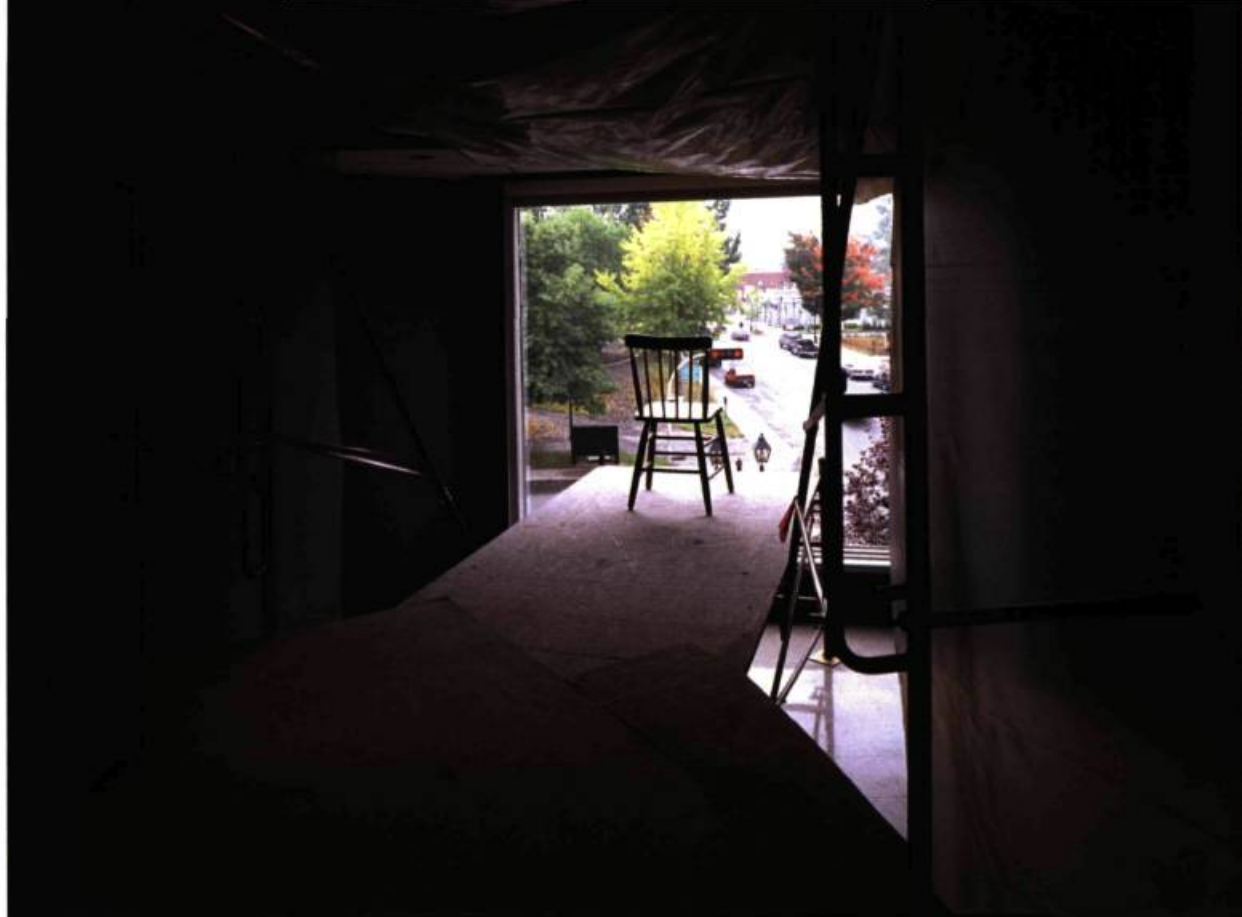
Richard Purdy, L'atlas de l'au-delà, Le Purgatoire , 2000. 33,0 x 1, 50 m.

urbaine et du quotidien 3 . Il faut admettre qu'on est beaucoup plus proche de Baudelaire que de Dante car c'est bien la figure du flâneur, la liberté fictive du voyeur et la célébration de la subjectivité qui viennent à l'esprit du haut de ce purgatoire.