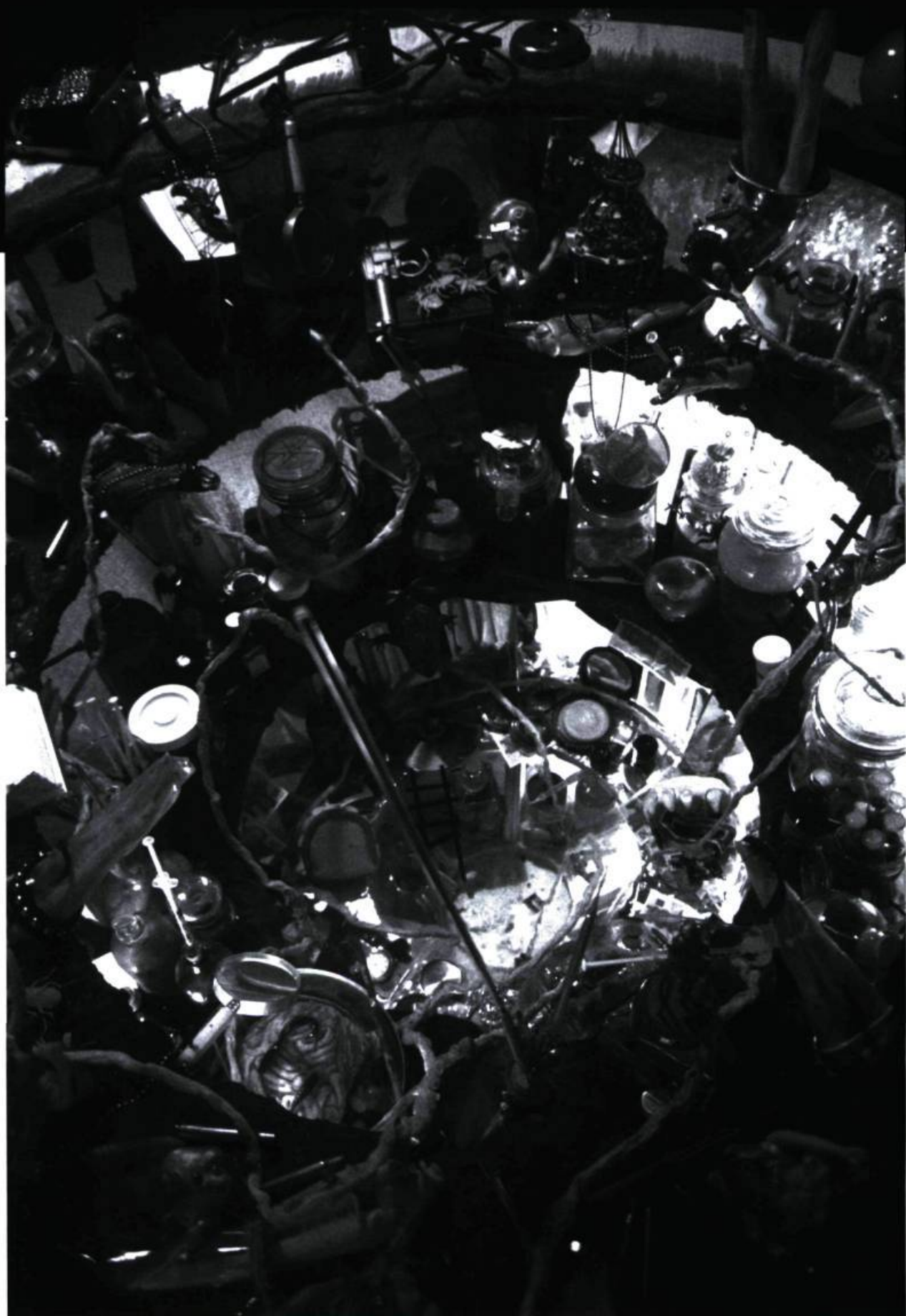
Richard Purdy, Atlas de l'Au-delà, l'Enfer , 2000. Détail; 1,10 x 0,9 m.