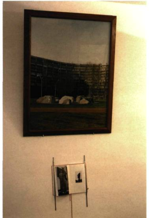
Sophie Calle, Lenin-Denkmal , 1996. Photographie.

Obéissante, Calle commence de nouvelles aventures, s'approprie ainsi un lieu public à l'angle des rues Greenwich et Harrison, une cabine téléphonique qu'elle embellit pour en faire un lieu convivial, distribue des sourires, sandwiches, cigarettes et con-