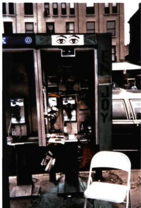
Sophie Calle, Gotham Handbook , 1998.

versations aux passants – et prend quelques photos. Bilan global : « 125 sourires donnés pour 72 sourires reçus; 22 sandwiches acceptés pour 10 refus; 8 paquets de cigarettes acceptés, pour 0 refus; 154 minutes de conversation » 10 , nous informe le cartel en fin d'exposition. 11