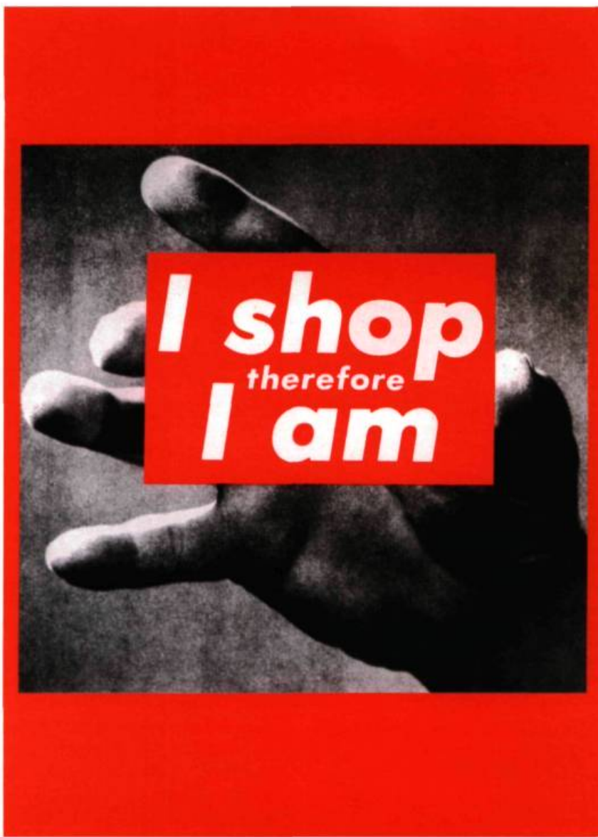
Barbara Kruger, Sans titre , 1987.

ou des époques baroque et maniériste), mais aussi d'une certaine vision sexiste de la femme (et pourquoi pas, pendant qu'on y est, des hommes qui chez Currin ont toutes les caractéristiques d'une virilité exacerbée : barbe et pipe).