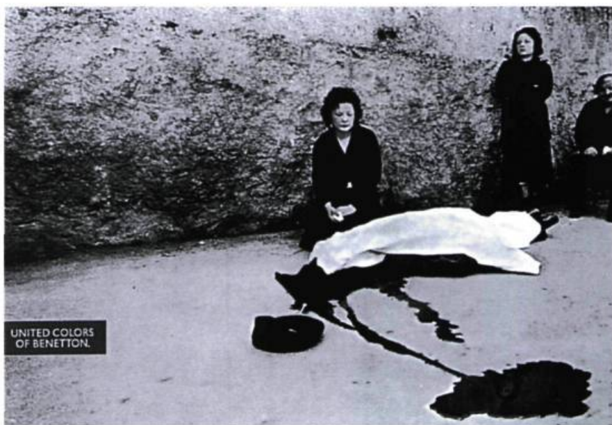
Franco Zecchin/Magnum (photo), O. Toscani (conception), Printemps/été, 1992. Publicité de Benetton.

À l'heure actuelle, l'art utilisant l'ironie énonce souvent un retour en force de la notion de métier, du travail bien fait aux dépens du ton ironique porté par ce style. Bien sûr, on se doit ici de parler du travail sculptural de Jeff Koons. Celui-ci, à l'évidence, fait bien plus dans la glorification du mauvais goût petit-bourgeois, de l'esthétique friquée d'une classe américaine acculturée en mal d'événements « in » et « hot », qu'une critique de ces codes. L'intérêt de Koons pour le travail des artisans (par exemple, les Italiens experts dans le maniement du marbre), dont il s'approprie le labeur, est une preuve de cette fascination pour la tradition artistique. Il participe à des valeurs de droite qui font du travail une valeur marchande pouvant procurer une plus value commerciale et esthétique. Avec Currin,