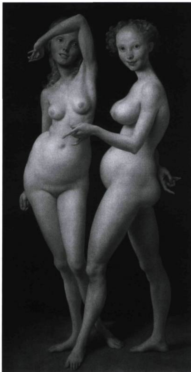
John Currin, The old Fence , 1999. Huile sur toile; 193 x 101 cm. Coll. Carnegie Museum of Art, Pittsburg; achat de A. W. Mellon.

QUELLE BELLE PEINTURE ! EH BIEN, FAITES-EN PLUS !