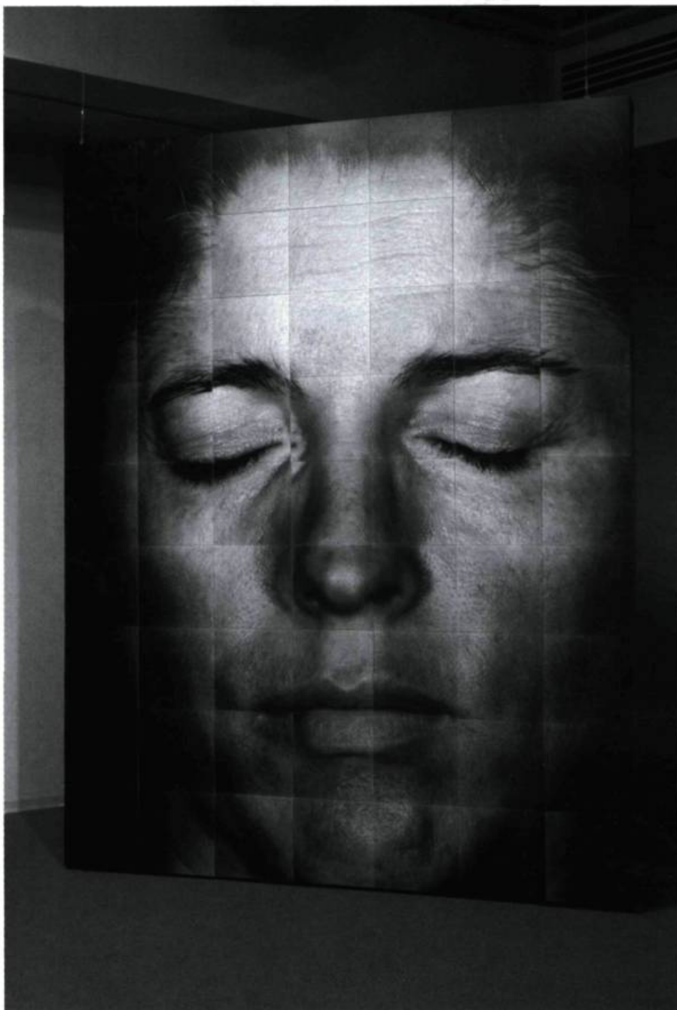
Roberto Pellegrinuzzi, Série Les Écorchés , 1999. © Galerie de l'UQAM, Montréal. Photo: Richard-Max Tremblay.

négatifs, après avoir servi pour un premier bloc visager, est retourné pour la constitution d'un second. Cet effet miroir, créé de toutes pièces par l'artiste, est assez troublant. Il en va ainsi de chaque image, comme si elle se retrouvait devant son reflet dans une glace. Cette étrange stratégie m'apparaît double. D'une part, elle crée une sorte de situation presque « existentielle », puisque la photo se trouve ainsi devant son double comme un visage réel elle serait face à un miroir.