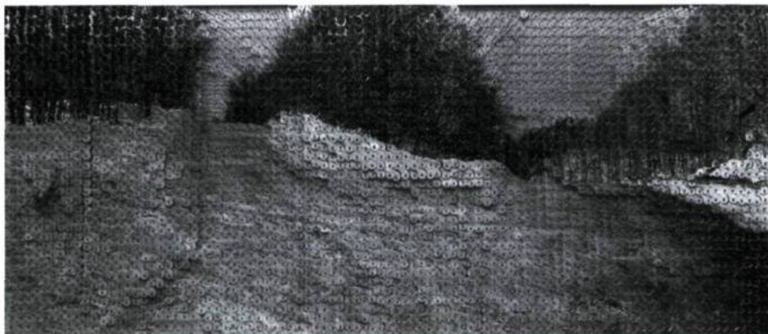
Roberto Pellegrinuzzi, Cible/Paysage III , 1999. Coll. de l'artiste.

Roberto Pellegrinuzzi, Les Écorchés , commissaire : Louise Déry, Galerie de l'UQAM, Montréal. Du 1 er septembre au 9 octobre 1999