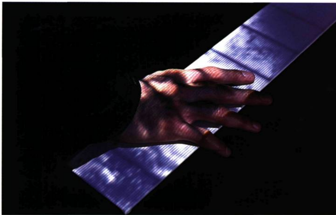
Sensorium, Beware O2: satellite , 1998. Ordinateur, Internet, appareil de contrôle de température; 3,05 m x 2,74 m x 2,74 m.