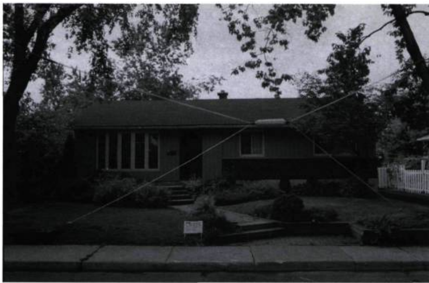
Cozic, Marquage , Intervention in situ, Longueuil, 1998.

appui sur une remise en question des conditions d'exposition dans le travail des Cozic et que Connolly situe dans la lignée des pratiques formelles et idéologiques des Constructivistes russes du début du siècle. Les références à l'art pop, l'art minimal, l'anti-forme, l'art pauvre et le Land art sont également prises en compte dans le texte dense du très beau catalogue qui accompagne l'exposition. C'est dire la pléthore de lectures possibles, y compris la part d'humour, d'éphémère, de poésie et de clins d'œil au quotidien, qui collent à l'œuvre des Cozic.