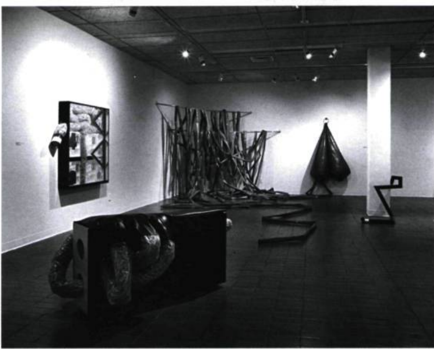
Cozic, vue partielle de l'exposition à Plein sud. De g. à dr. : L'échappé Bêlé , 1967; Complexe mammaire , 1970; Objet-Jouet: Sine Caudae , 1967. 1 er plan: Cercueil à roulettes , 1968.

merce possèdent un rôle majeur dans la conception formelle et idéologique de l'exposition. Ils pointent une appropriation libre du matériau (ceux-ci relevant du domaine industriel et populaire) une implication active du spectateur, un rejet du système académique dans une visée essentielle de démocratisation de l'art.