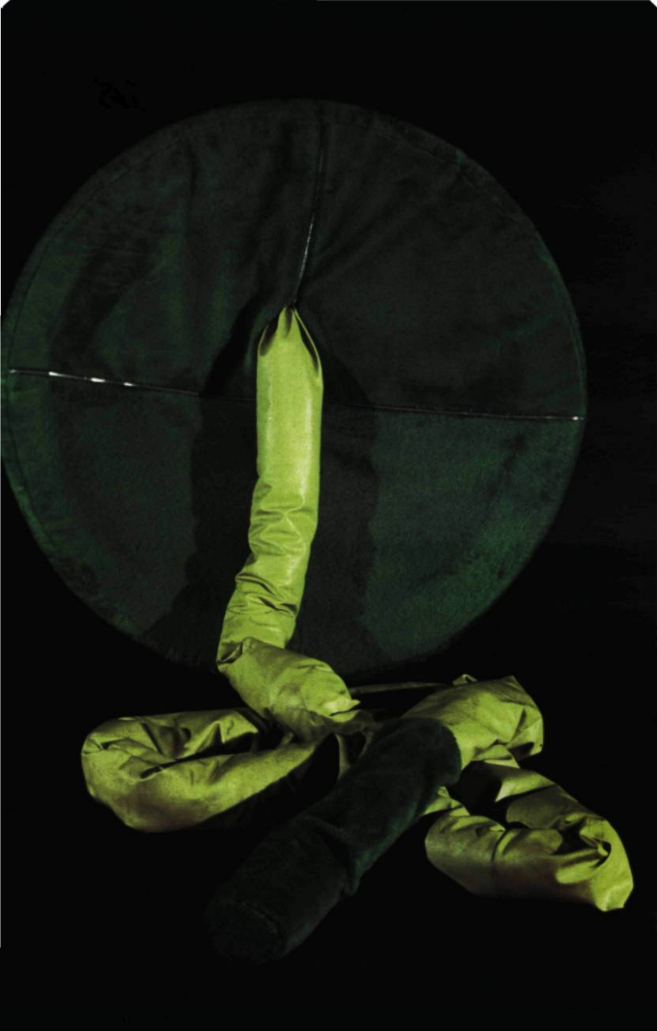
Cazic, Coucou-minou , 1970. Bois, vinyle, Kodel, peluche. 122 x 122 x 516 cm. Collection: Banque d'œuvres d'art du Conseil des Arts du Canada, Ottawa.