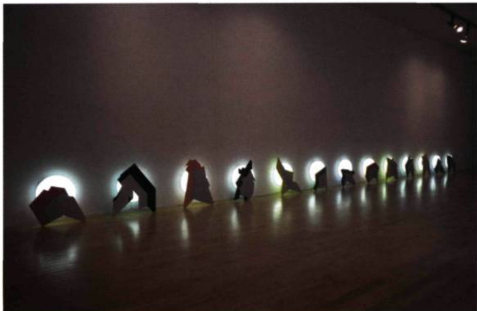
Cozic, Les Trapus Fugitifs , 1998. 13 éléments de 35 x 50 x 15 cm chacun; lumière, plastique, bois, acrylique.

Cozic, Cozic: architecturer l'informe. Fragments rétrospectifs 1967-1998 , commissaire: Jocelyne Connolly, Plein sud, du 6 août au 27 septembre 1998. Rythme cicardien , Galerie Graff, Montréal, septembre 1998.