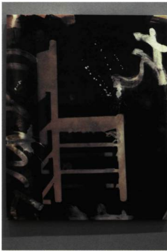
Photoprint de la série Tàpies : Suite Montseny , ca. 1960.

comme un Miró ? Jusqu'à quel point l'institution canonise-t-elle les objets qui y sont contenus et fait-elle pression pour nous les faire accepter ? Jusqu'à quel point devient-on docile face au pouvoir que le musée représente et perd-on notre sens critique ? Mais aussi, jusqu'à quel point l'establishment du musée allait-il me permettre ce jeu de transgression ? Le musée doit-il fonctionner comme le mausolée qui rend un culte et surveille la mémoire d'un artiste du passé, ou doit-il devenir, justement à partir du prétexte de la mémoire de cet artiste, une plate-forme qui stimule la créativité et l'imagination des générations suivantes ?