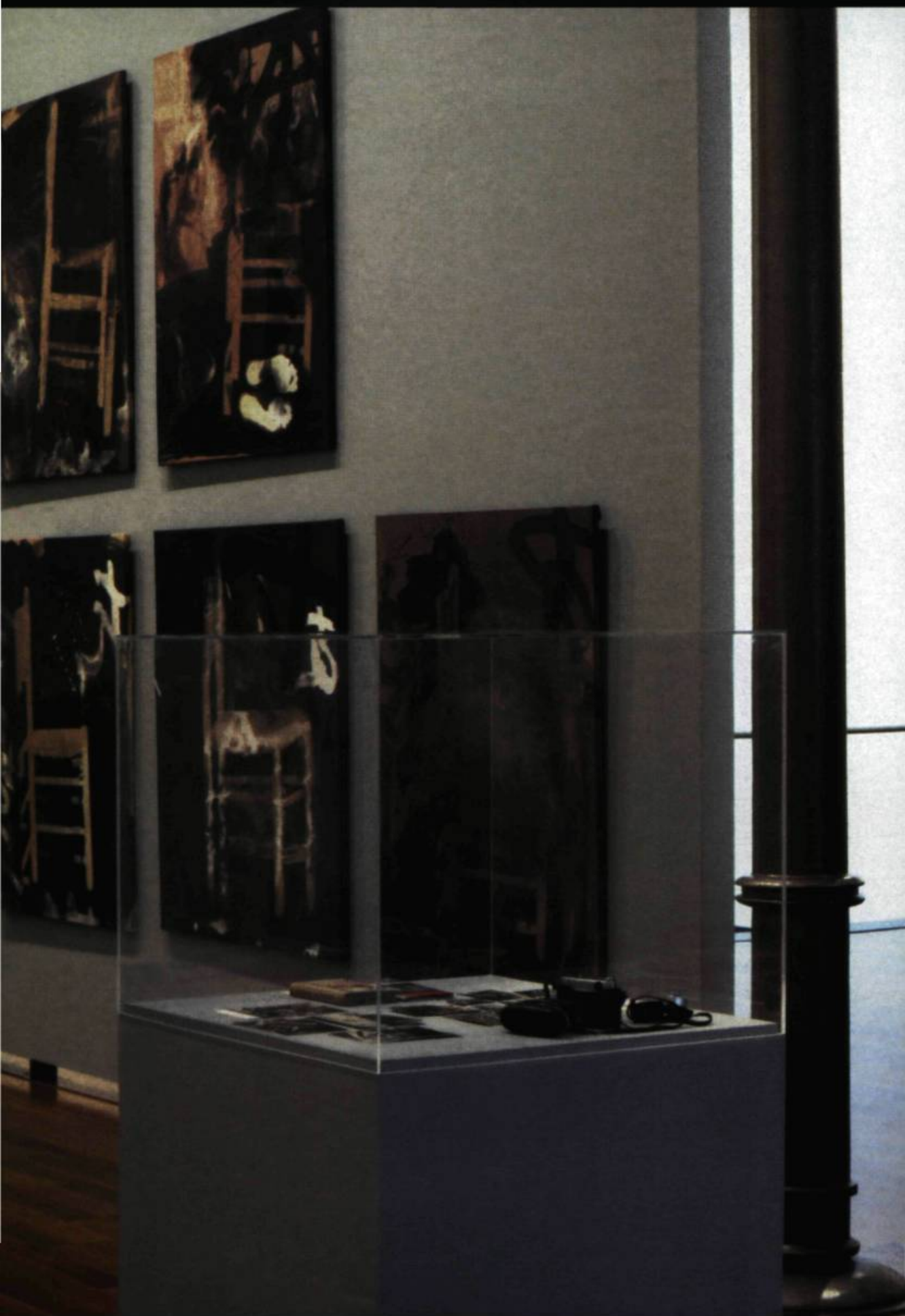
Installation à la Fondation Tàpies, Barcelone, 1995.