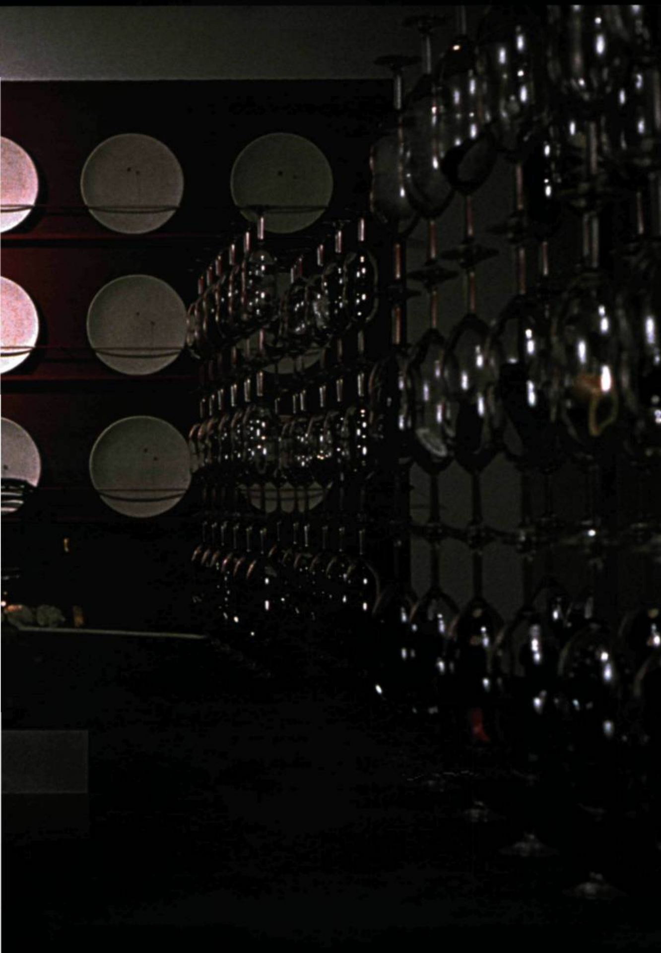
Louise Marillie, Les tables de la loi , 1997. Installation in situ ; sucre, cellophane, coupes inversées, petits fruits, pièces de monnaie, minuscules cônes humains... (Détail).