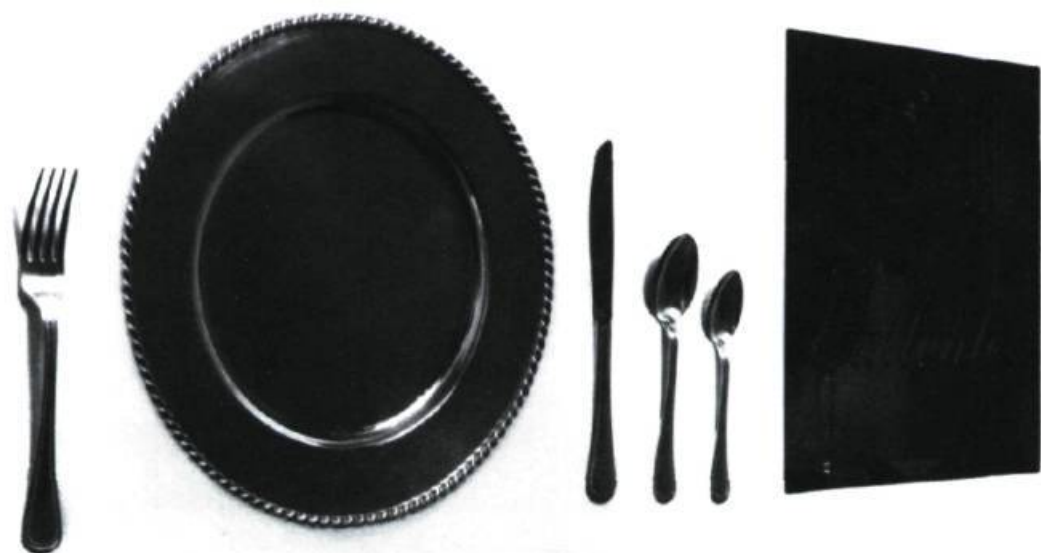
Lucie Duval, À son seul désir , 1996. Couvert, assiette en argent, coupe, vin, fleurs, vitre gravée.

tout, cette robe de mariée, conçue spécialement pour elles. Cette image de housse s'estompe peu à peu à la vue d'une rangée de boutons.