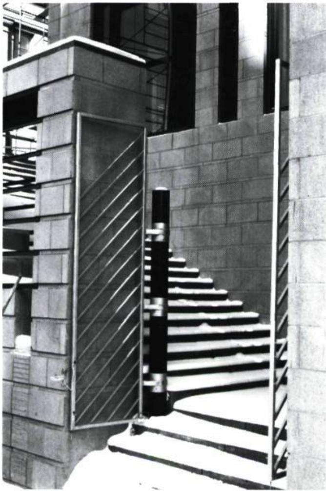
Immeuble Chaussegros-de-Léry, entrée Rue Gosford, Montréal, 1992.

D.H. : J'ai réglé mes comptes avec Mario. J'ai pris une photo des habitations Quesnel que j'ai laissée à Luganu, chez lui, avec une note qui disait : ça c'est du Dan Hanganu ! On a les mêmes sources, l'architecture byzantine, qu'est-ce que vous voulez ? Mais aujourd'hui il n'y a plus du tout de ressemblance entre ce qu'il fait et ce que je fais.