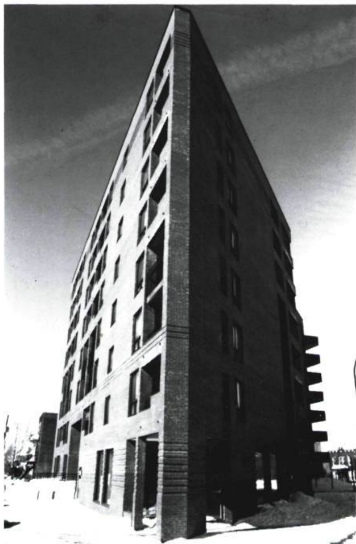
Dan S. Hanganu, Habitations Crémazie , Montréal, 1986.

architecture et dont on parle très peu : la lumière. Comment l'appriivoisez-vous, quelle importance lui accordez-vous ?