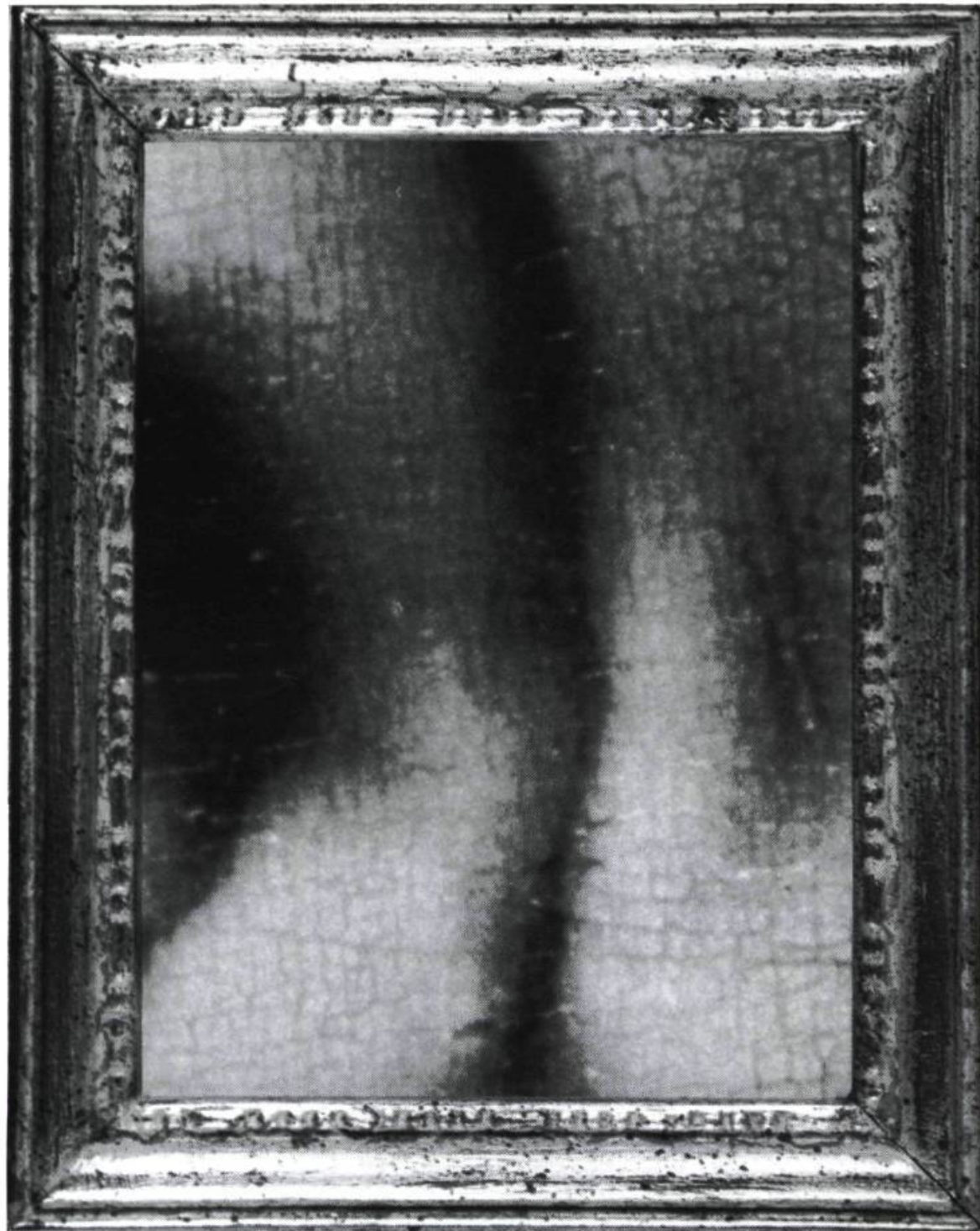
Suzanne Giroux, L'énigme du sourire de Mona Lisa , 1992. Musée du Québec.

Pour terminer, une sorte de conclusion s'impose. Les nombreux objets produits dans la dernière décennie représentent souvent les goûts cachés de l'artiste tant en peinture, sculpture, photographies ou autres expressions. Cette organisation d'objets ne serait-elle pas la présence forte de ce qu'est la nature morte ?