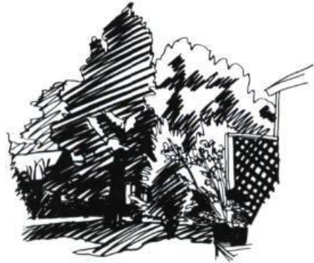
Tom Wesselmann, Jeannie's Backyard, East Hampton (noir) , 1990. Coupée au lazer, acier