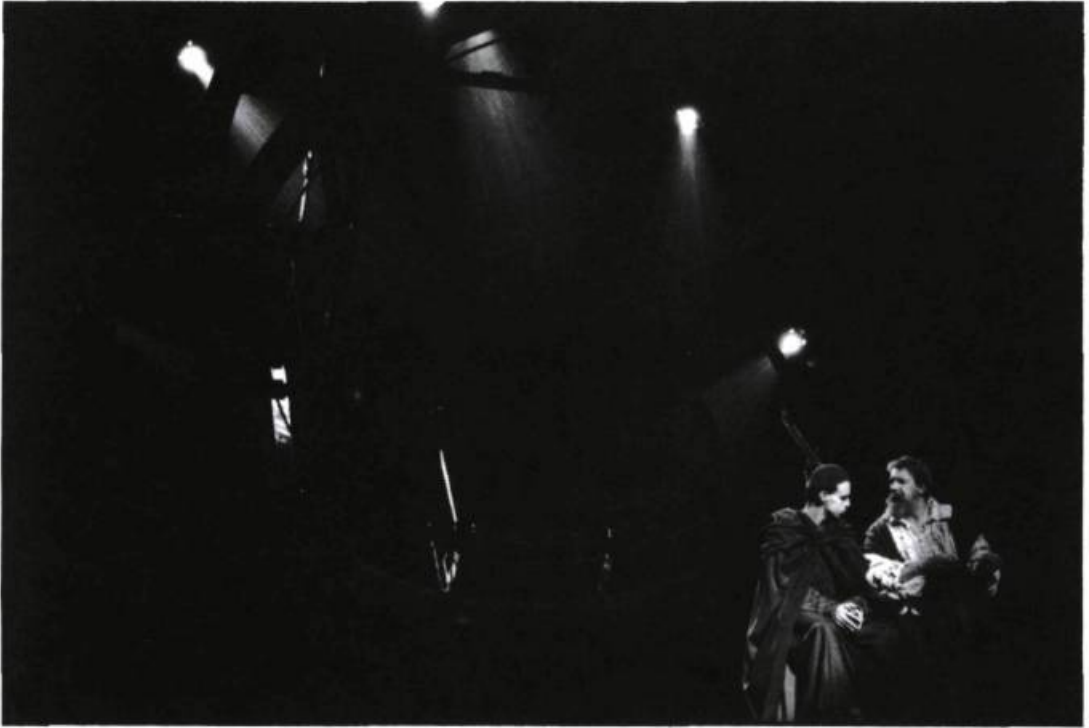
La Vie de Galilée de Bertolt Brecht.