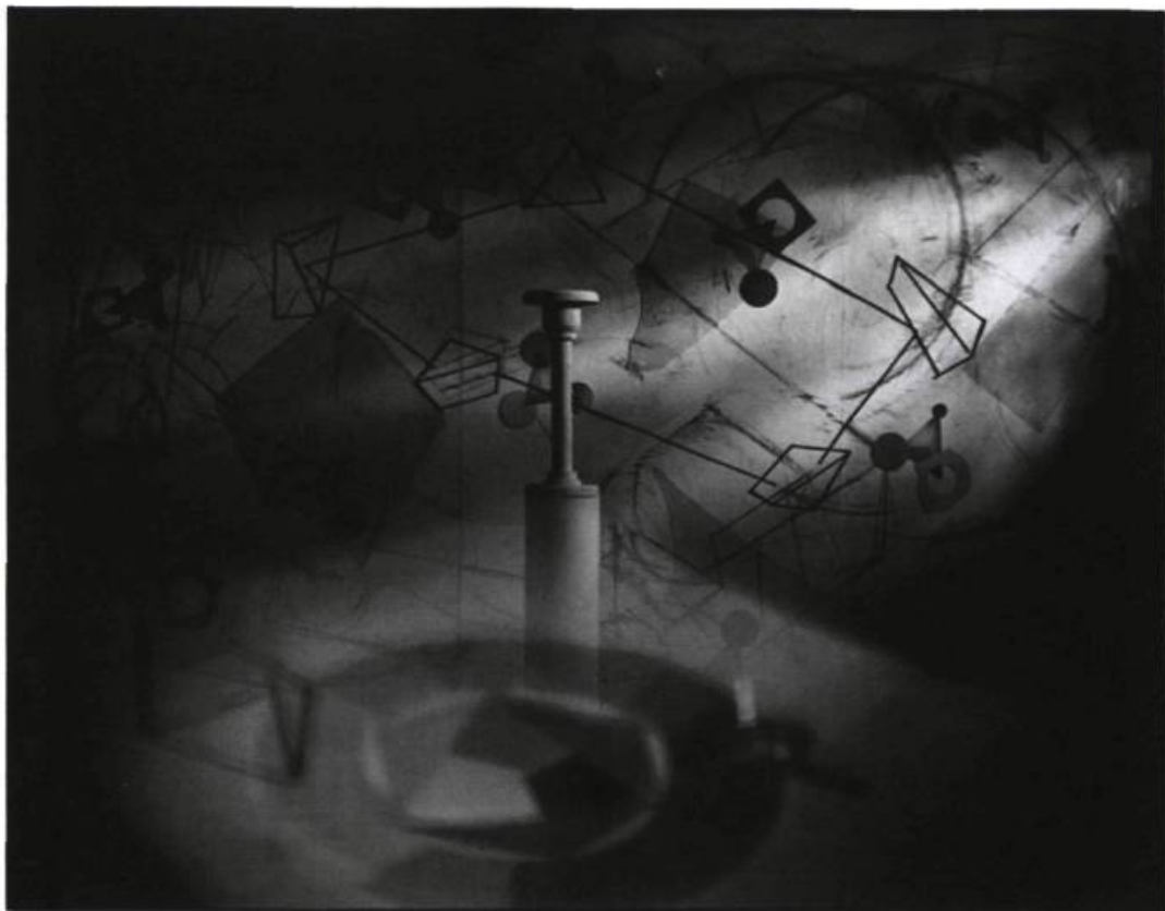
Serge Tousignant, L'intangible motif , 1987. Photographie couleur, 127 x 101,6 cm. Collection du Musée canadien de la photographie contemporaine, Ottawa

simultanément deux types de lumière, l'une naturelle et l'autre artificielle, et provoque donc des effets chromatiques assez intéressants.