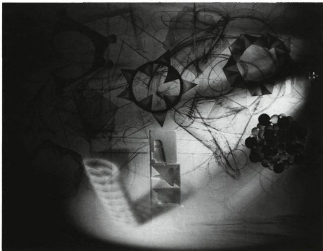
Serge Tousignant, La tour d'ivoire , 1988. Photographie couleur; 127 x 101 x 6 cm

qui est beaucoup. Ce sera presque une exposition individuelle. Par contre, pour le volet de présentation à Montréal, en novembre 1988, le nombre de pièces est moindre, mais suffisant pour comprendre la problématique d'un travail qui a été vu par bribes jusqu'à présent. Sur une production d'une quinzaine de pièces environ, deux seulement ont été montrées ici à l'exposition Le dessin errant .