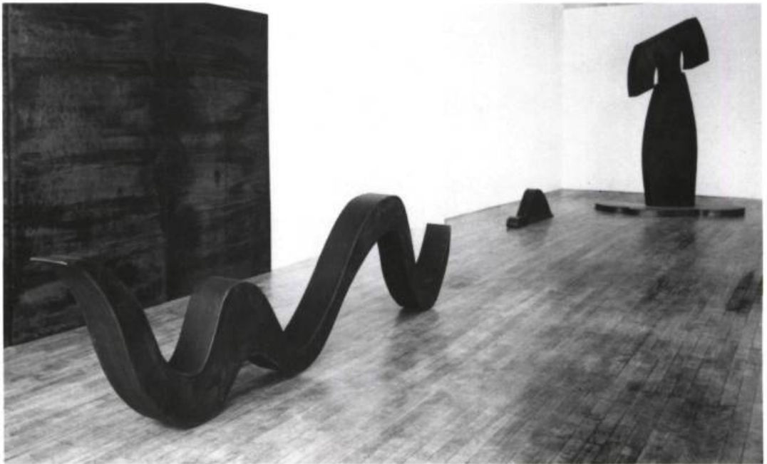
Yves Louis-Seize (left to right) Serpere , 1988. Steel; 183 x 335 x 122 cm. Sans titre (the turtle), 1988. Steel; 31 x 92 x 15 cm; and Isola , 1988. Steel; 244 x 122 x 137 cm.