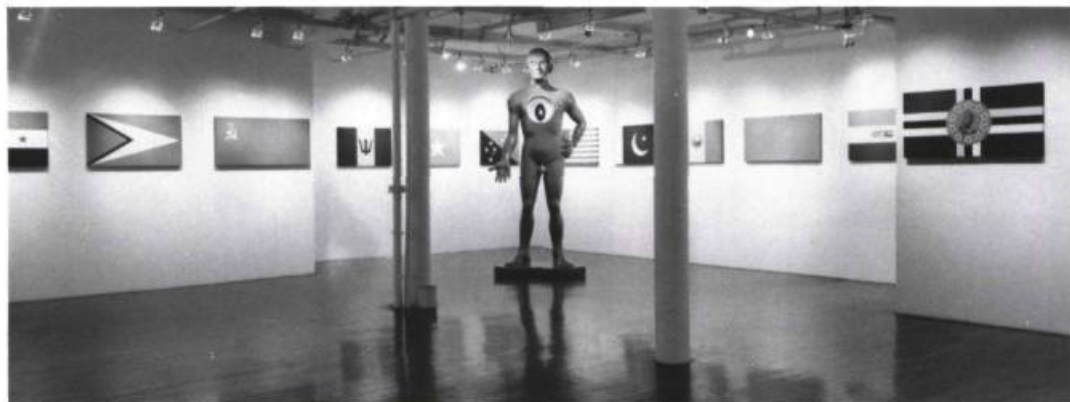
Jonathan Borofsky, installation à la Paula Cooper Gallery, 1988.