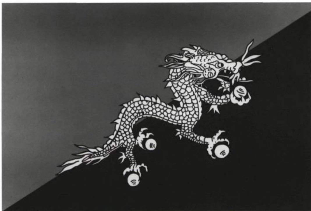
Jonathan Borofsky, Bhutan , 1988. Acrylique sur toile; 30 x 45 po. Reproduction autorisée par la Paula Cooper Gallery, New York