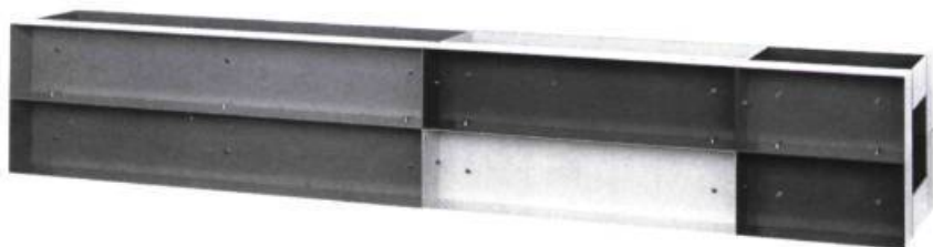
Donald Judd. Pulvérisation sur aluminium, 1984

P aris : Donald Judd — Pour la première fois en France, l'œuvre de Donald Judd vient de faire l'objet d'une rétrospective. Fidèle à une politique qui consiste à alterner d'importantes manifestations de caractère international et des expositions réservées à de plus jeunes talents, l'A.R.C. (Musée Municipal d'Art Moderne) a accueilli cette grande rétrospective, qui, après Eindhoven, Düsseldorf et Paris, sera présentée à Barcelone.