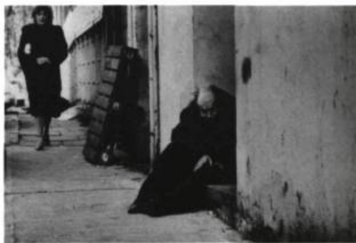
Don McCullin, East of Aldgate , 1985. ( L'Empire du réel / Realities Revisited )

L'Empire du réel/Realities Revisited , au Centre Saidye Bronfman, du 16 juin au 16 juillet 1987 — De son côté, le Centre Saidye Bronfman présentait un solide corpus de 112 photographies britanniques datant des 40 dernières années, de quoi alimenter le vieux débat entre les tenants de la photo documentaire et ceux de la