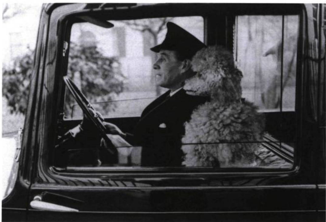
Thurston Hopkins, La dolce vita , London, 1953. ( L'Emprise du réel / Realities Revisited )