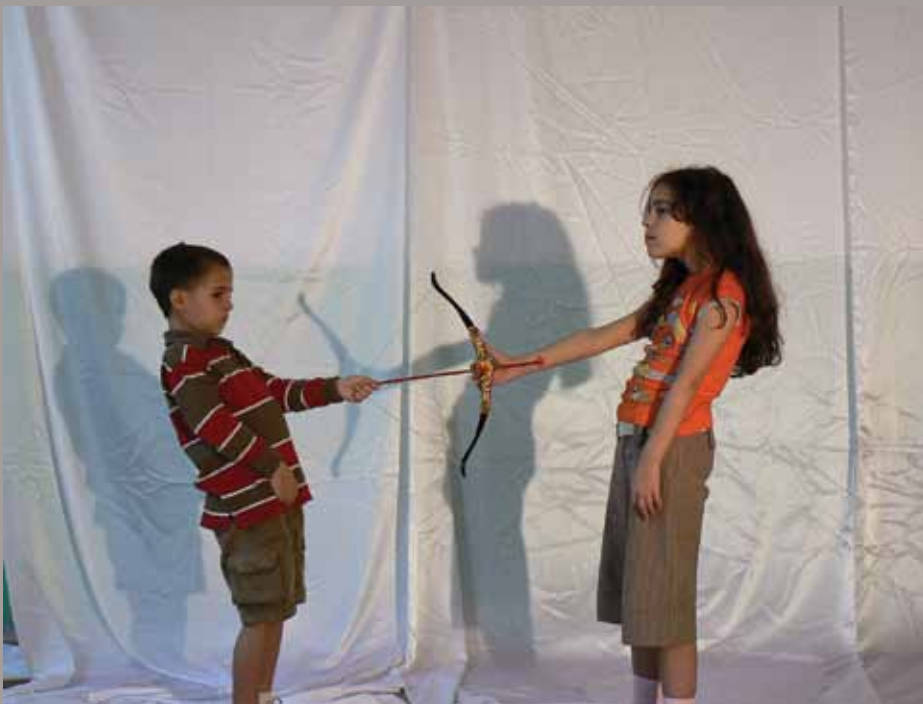
Guillaume Désanges, Abramoviculay . © Guillaume Désanges & Work Method. Performé à Materializing the Social , Experiencz # 2 , Wiels, 18-21 avril 2013.