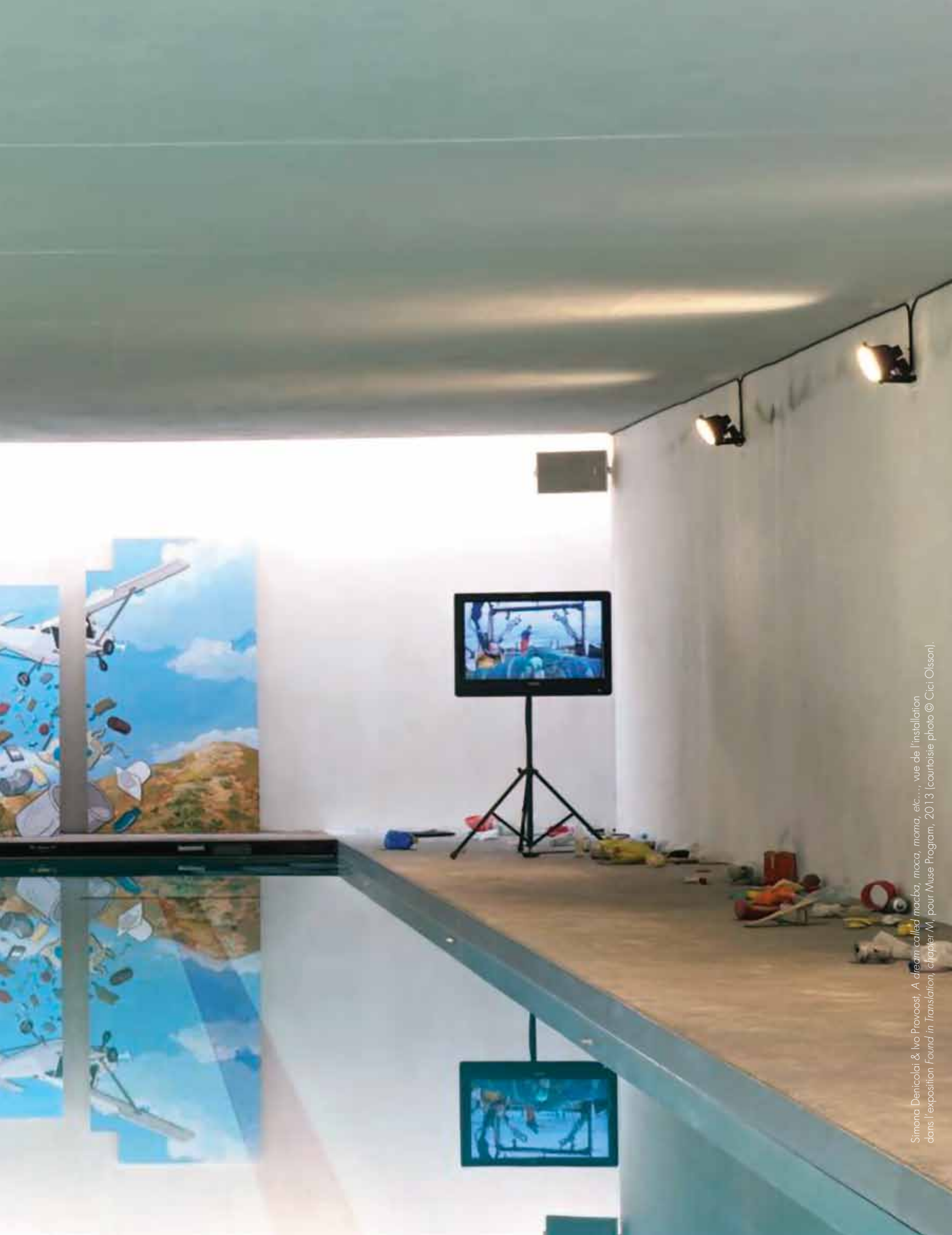
Simona Denticolai & Ivo Provoost, A dream called mascha, moca, moma, etc..., vue de l'installation dans l'exposition Found in Translation, chapitre M, pour Muse Program, 2013.