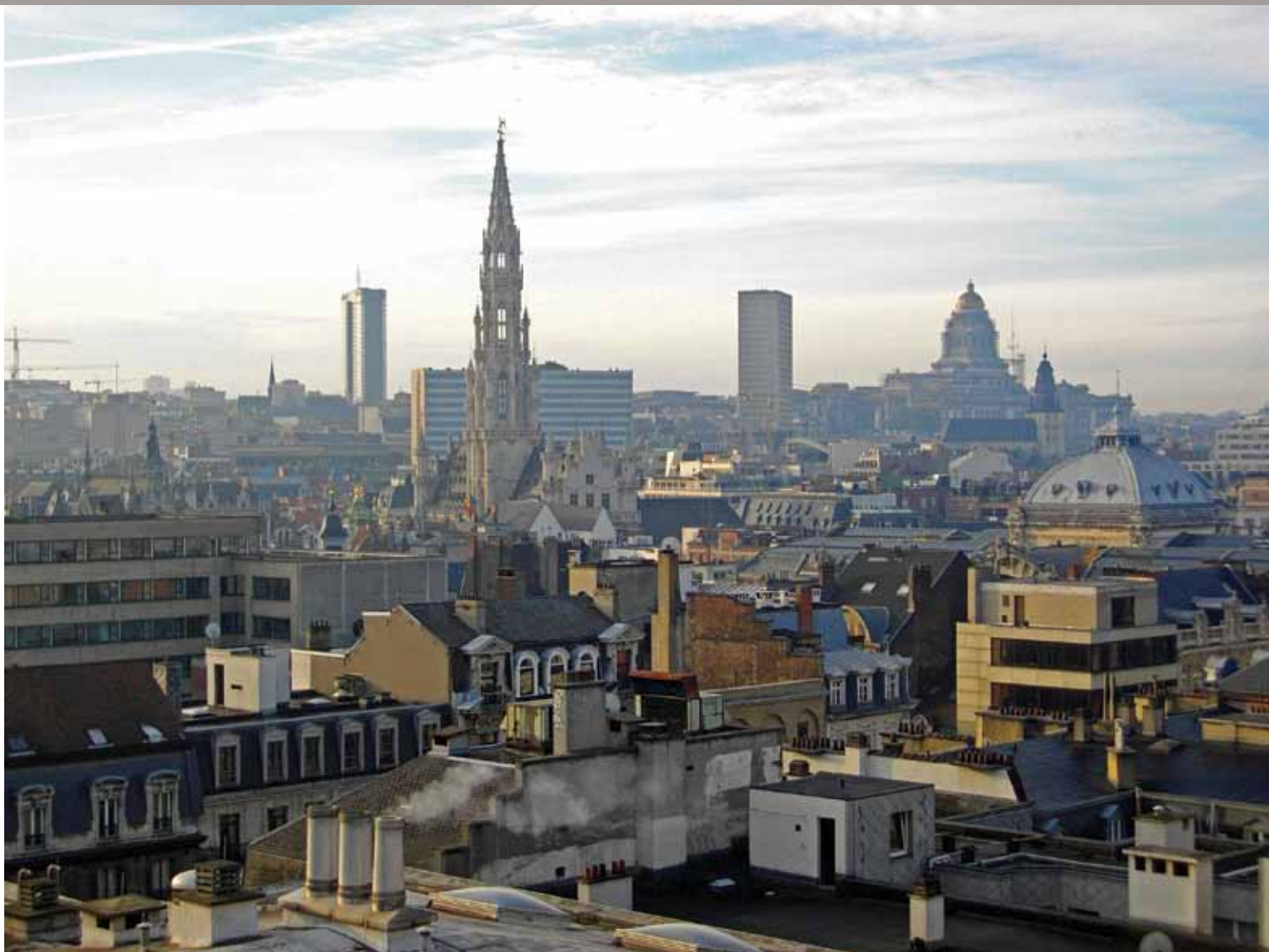
Parking 58, projet dans l'espace public bruxellois, sous commissariat d'Emmanuel Lambion.