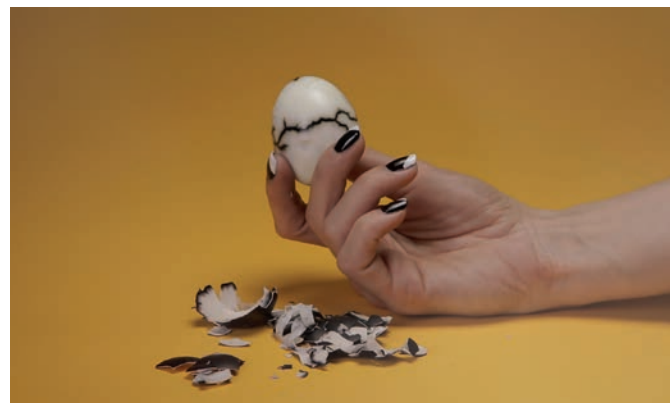
Camille Henrot, Grosse Fatigue , 2013.