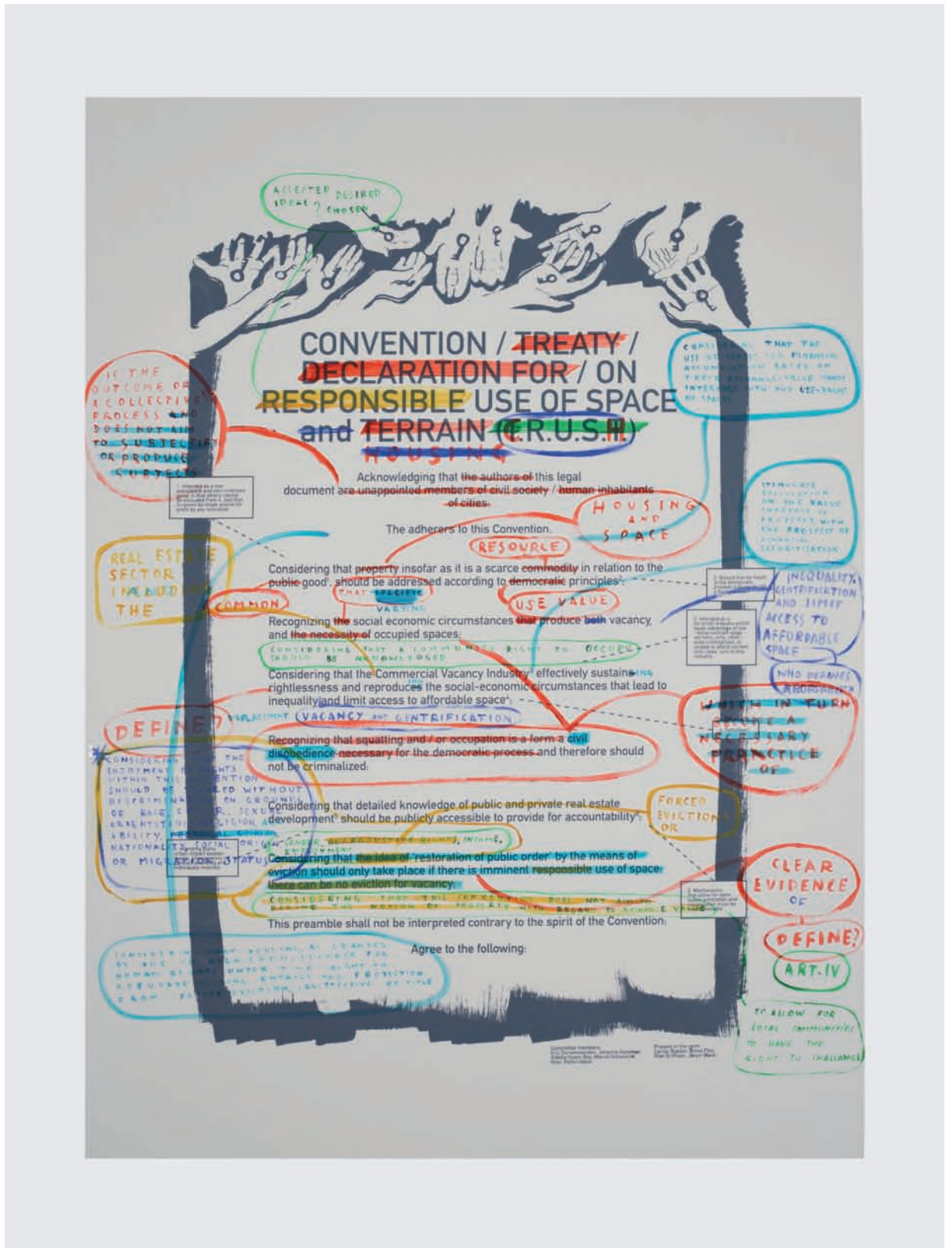
Adelita Husni-Bey White Paper: The Law, détail | detail, 2015.