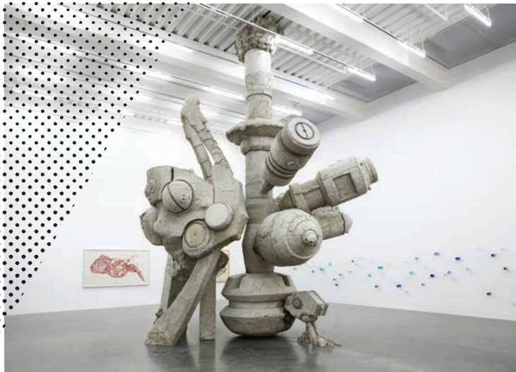
Adrián Villar Rojas, A Person Loved Me , 2012.