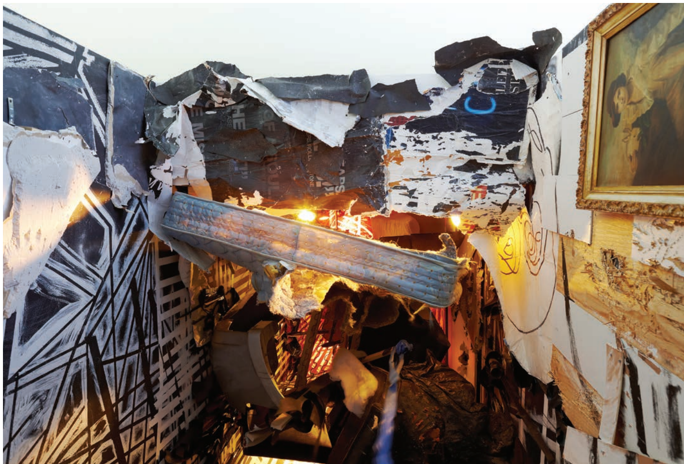
Abigail DeVille, Dark Day , 2012.