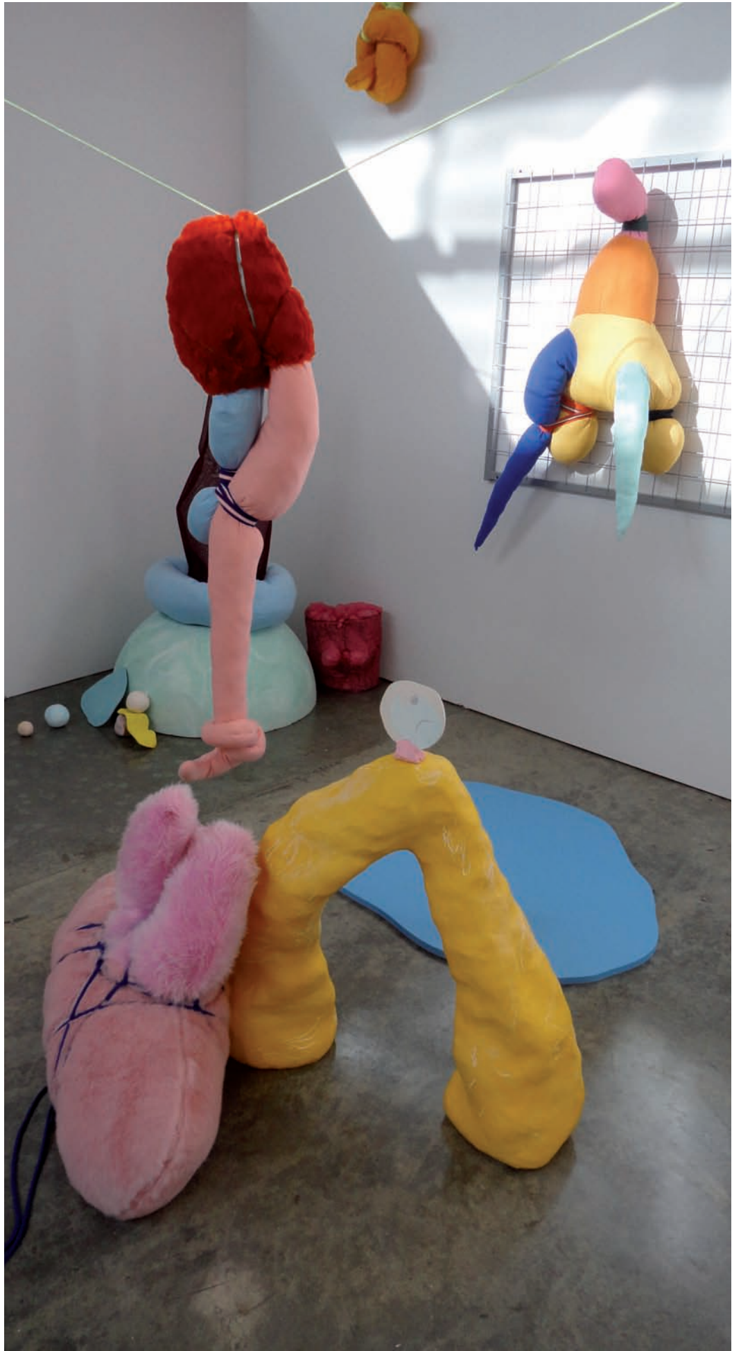
Juli Majer & Melanie Thibodeau Soft Stay/Safe Play , vue d'installation | installation view, Emily Carr University of Art & Design, Vancouver, 2014.