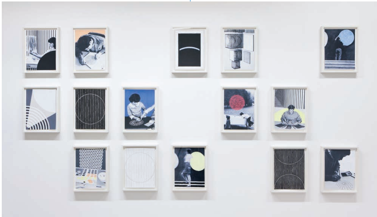
Derek Sullivan, Fifteen Illustrations for (and/or from) a book that is (and/or will be) titled More Young Americans , 2011.

En quoi consiste le résidu de l'abstraction? Comment son sens change-t-il au fil du temps et de la traduction? Où se manifeste-t-il, dans nos vies? Le travail récent de Derek Sullivan table sur un aspect clé de l'abstraction : son rapport insaisissable, changeant et parfois arbitraire au sens. Puisant à une grande variété de sources bibliographiques, l'artiste approche les histoires du design moderniste, de l'abstraction et de l'art conceptuel comme un champ de signes en suspension. Il accorde une attention particulière aux formes et aux motifs récurrents, dont il tisse de nouveaux rapports au sens avec une agilité aveugle. Les images qui en résultent paraissent familières, évoquent une curieuse ressemblance, mais au final, échappent à l'interprétation.