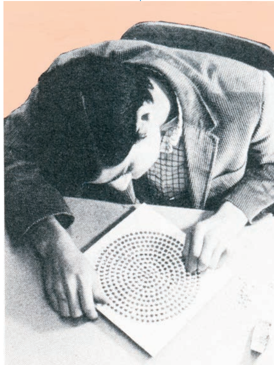
Derek Sullivan, Fifteen Illustrations for (and/or from) a book that is (and/or will be) titled More Young Americans (détail | detail), 2011.