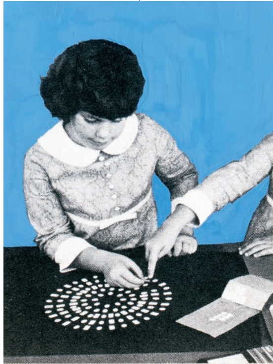
Derek Sullivan, Fifteen Illustrations for (and/or from) a book that is (and/or will be) titled More Young Americans (détail | detail), 2011.