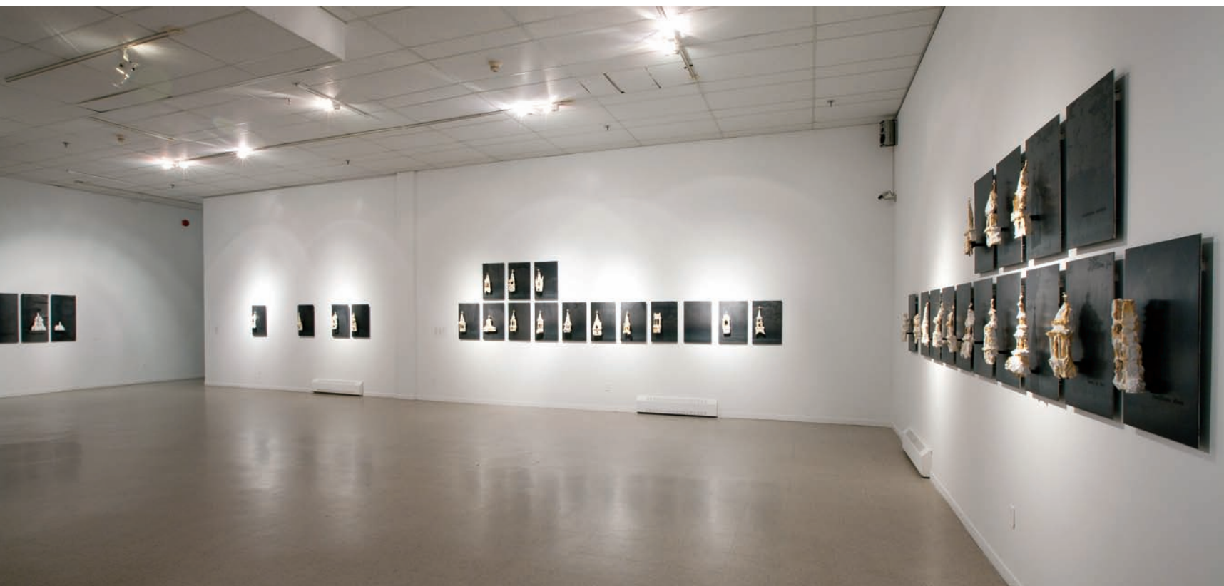
Pierre LEBLANC, Signes et repères , 2011. Série de 61 plaques. Acier bleui et plâtre sur une structure de métal. 60 x 40 cm (chacune).