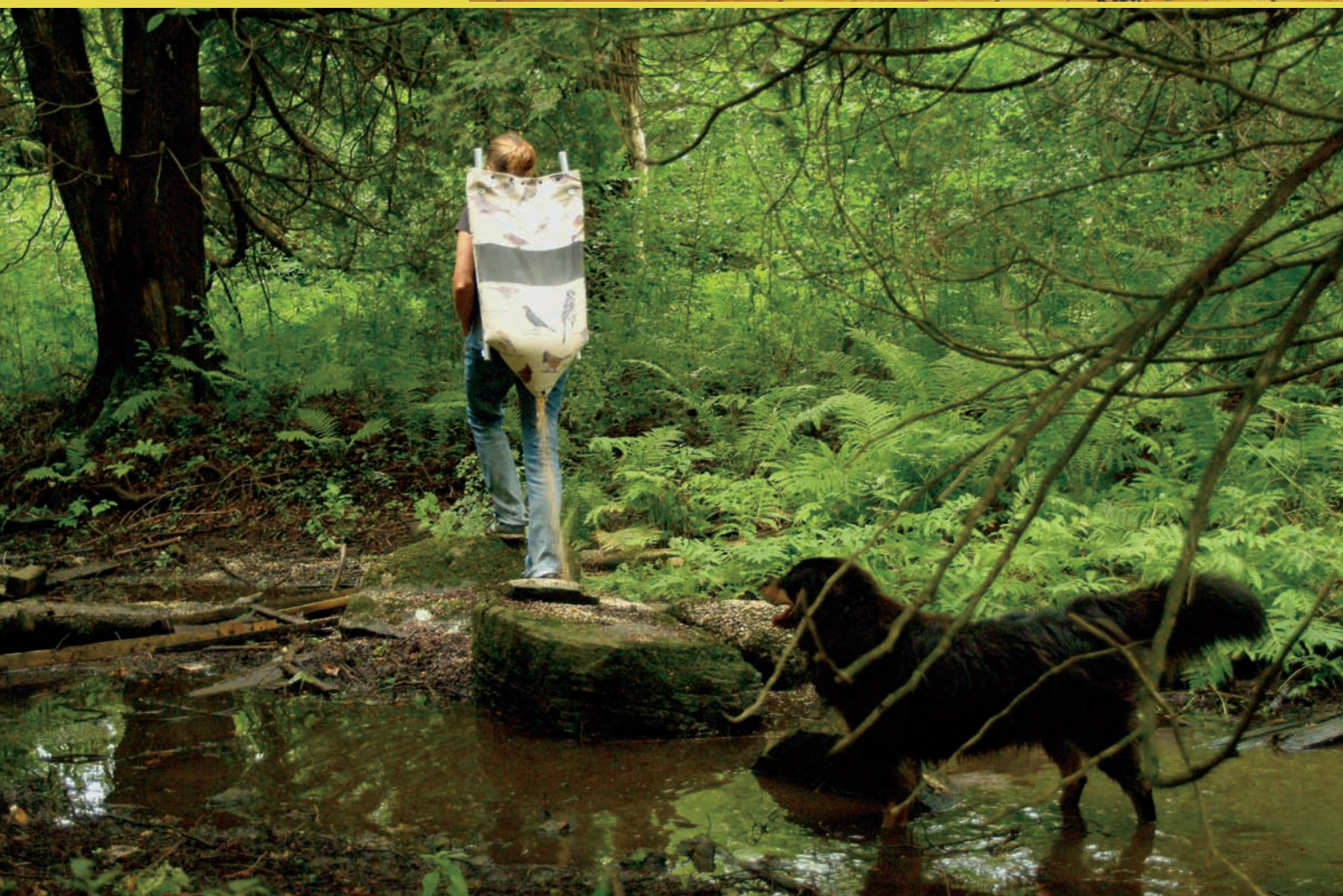
Susan DETWILER, Seedwalk , 2005. Performance (détail/detail).