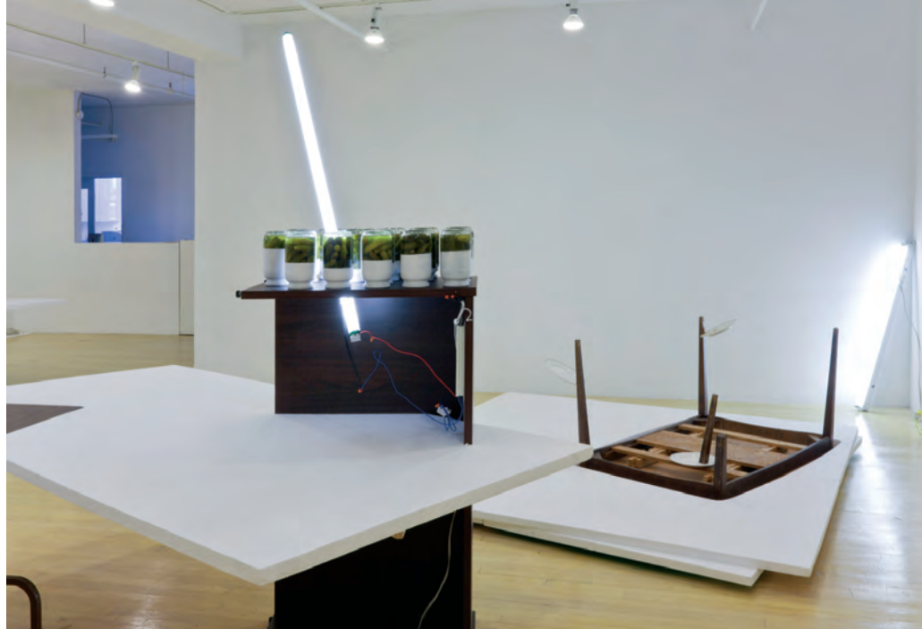
Manuela LALIC, Partage pratique, 2013. Bocaux de cornichons peints, 4 x 8 en polystyrène, mobilier usagé, assiettes, néons. Dimensions variables.