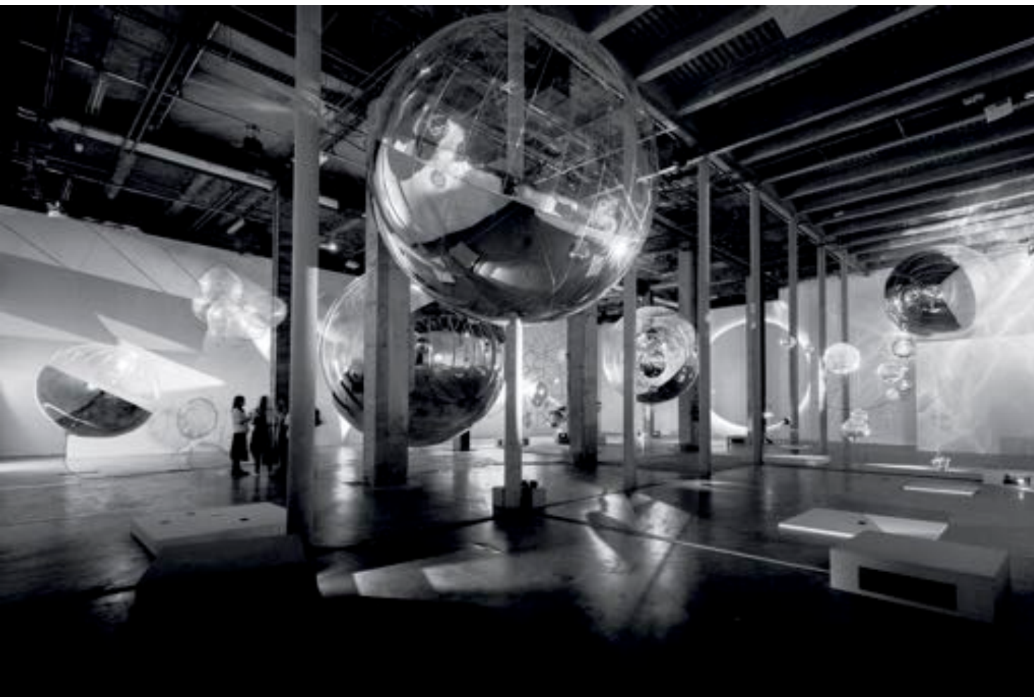
Tomás Saraceno , A Thermodynamic Imaginary, ON AIR , Palais de Tokyo, Paris, 2018. Avec l'aimable permission de l'artiste; Andersen's, Copenhague; Esther Schipper, Berlin; Pinksummer Contemporary Art, Gênes; Ruth Benzacar, Buenos Aires; Tanya Bonakdar Gallery, New York. © Photographie Studio Tomás Saraceno, 2018.

première de ses sculptures composées par diverses espèces dont il supervise la morphogenèse. Sa carte blanche ON AIR 3 métamorphose le Palais de Tokyo en une chambre d'écho où s'hybrident les bruissements imperceptibles du vivant. Physiologique, l'exposition s'organise autour de climats, de flux; glissant du visible vers l'invisible, du biologique vers l'atmosphérique. Plongeant les lieux dans une nuit ininterrompue, l'artiste-laborantin orchestre la polyphonie aléatoire et évolutive des forces élémentaires de la nature, des poussières, des musiciens humains et non humains. Il nous invite à sonder ces voix inaudibles, un chant d'inframance, une cohorte de phénomènes sensoriels non circonscrits par l'appareil perceptif humain. Le Palais de Tokyo devient une membrane sensible, connectant les appareils sensoriels des individus aux pulsions de la biosphère. Cette vaste tentative d'harmonisation cosmique croise diverses traditions de pensée : phénoménologie de l'habitation de Martin Heidegger, philosophie deleuzienne de la musique, théories post phénoménologiques et néo vitalistes de la rencontre, de l'affect et de l'hybridité de Donna Haraway ou de l'acteur réseau de Bruno Latour.