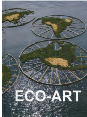
Eco-Art . © Pori Art Museum 2011. 221 pages. www.poriartmuseum.fi