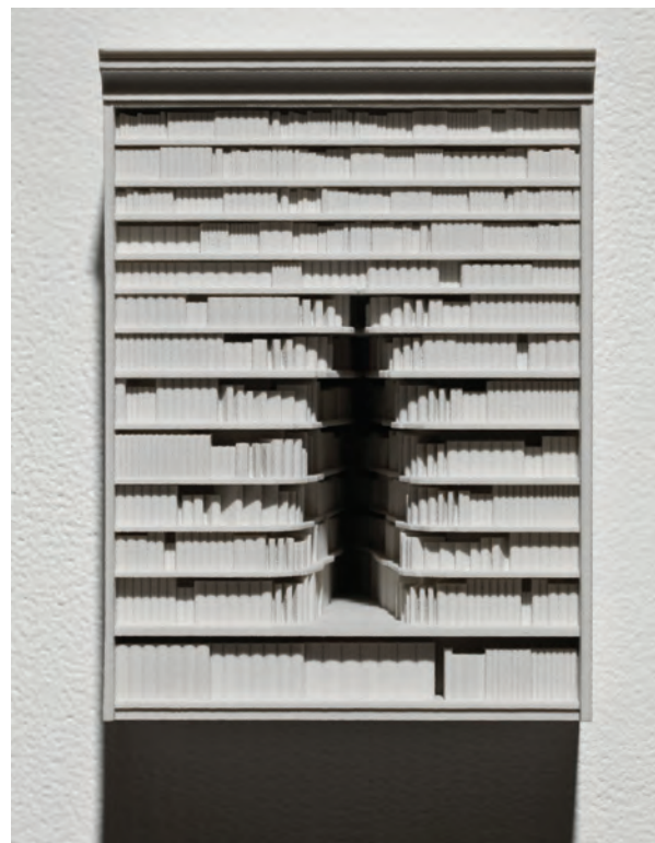
Guillaume LACHAPELLE, Fissure , 2009. Impression 3D, plâtre, époxy/3D Impression, plaster, epoxy. 16 x 11 x 15 cm. Édition : 5.

But beyond these tensions between size and scale—between which the viewer is torn— Village Démocratie focuses on the central manifestations of the contemporary boundless: the city (and its hypermodern version, the megalopolis), overurbanization , overconsumption , overdevelopment , virtuality and the boundlessness of capital flows as well as the staggering gap in wealth distribution (the image of which is translated through stock market indexes that “soar” above the slums, and proliferate in the reverberating mirror surfaces, which overhang them). The work's form and content thus come together and reinforce each other, multiplying the incommensurables and the size and scale tensions to be experienced and thought about. This is similar to Chris Burden's Metropolis II : a kinetic model of a “high density” futurist city, a real hive of activity in which miniature cars weave between skyscrapers, mosques, overpasses and residential complexes that are strangely unsettling in their self-propagation.