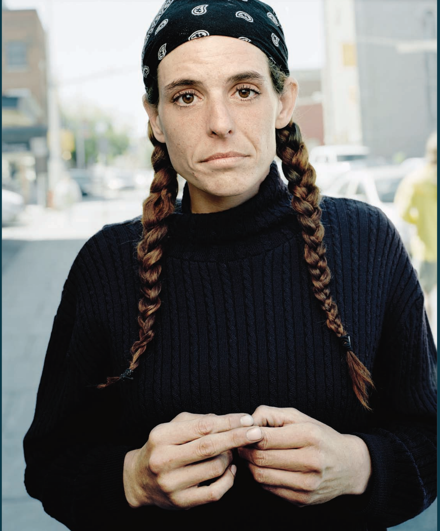
Tony Fouhse USER Portraits of Crack Addicts