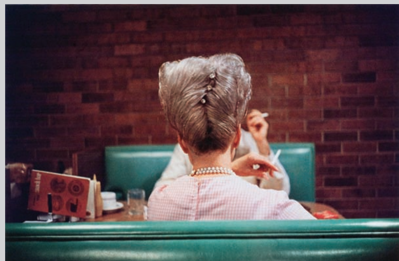
William Eggleston, Untitled, n.d., de la série Los Alamos, 1965-1968 and 1972-1974, transfer hydrotypique, 30,5 x 45,1 cm