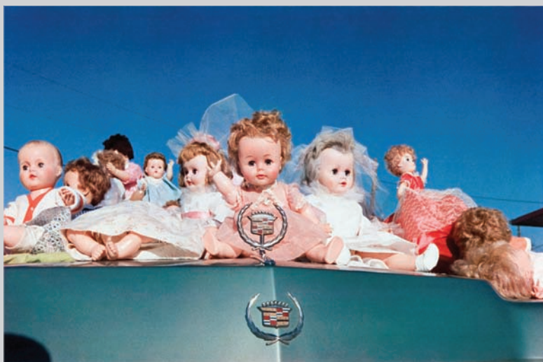
William Eggleston, Untitled, 1970, de la série Los Alamos, 1965-1968 and 1972-1974, transfer hydrotypique, 40,6 x 50,8 cm, coll. Whitney Museum of American Art, New York