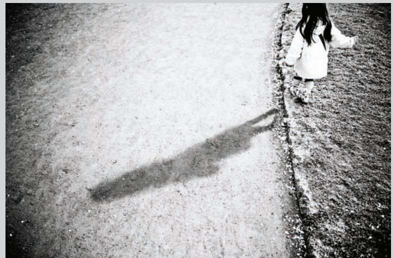
Laurent Guérin, Aomori 3 , 2008, digital print on Hahnemuhle paper, 58 x 86 cm