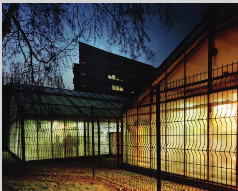
Eve K. Tremblay, Tropismes , 2006, c-print, 100 x 125 cm.