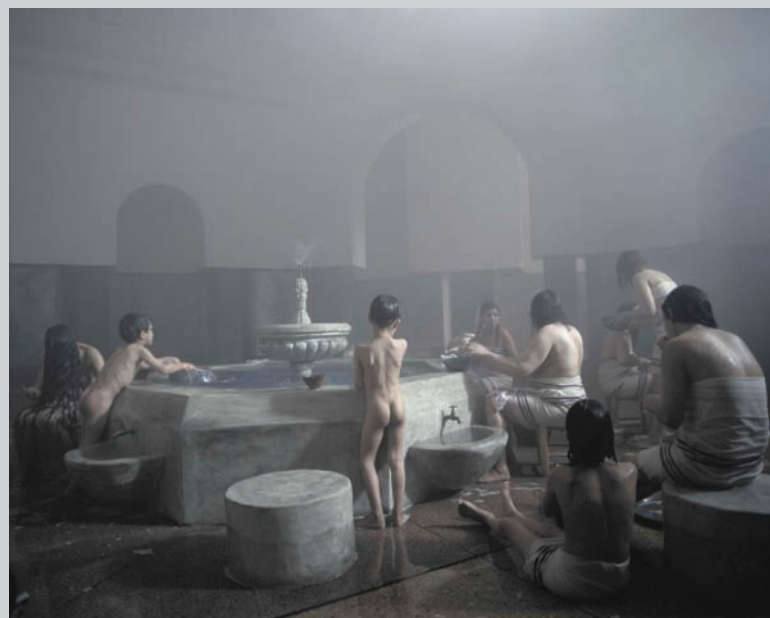
Women Without Men, 2009, image tirée du film, 95 min