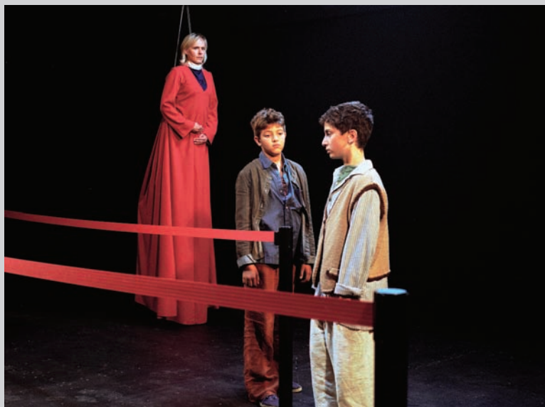
Eija-Liisa Ahtila, Where Is Where? , 2008, installation vidéo (HD) pour six écrans, © Crystal Eye – Kristallisilmä Oy, permission de Marian Goodmann Gallery, New York et Paris, photo : Marja-Leena Hukkanen

Ahtila articule ses propos troublants, qui relèvent de la hantise, de l'obsession et de la psychose, dans des productions raffinées et complexes, dont la mise en espace vise à engager notre réflexion en fragmentant notre perception. Ainsi fragilisés par le dispositif, nous nous trouvons en situation de sentir les états d'être et d'âme des protagonistes. Pourtant, les œuvres d'Ahtila sont terriblement maîtrisées, à l'op-