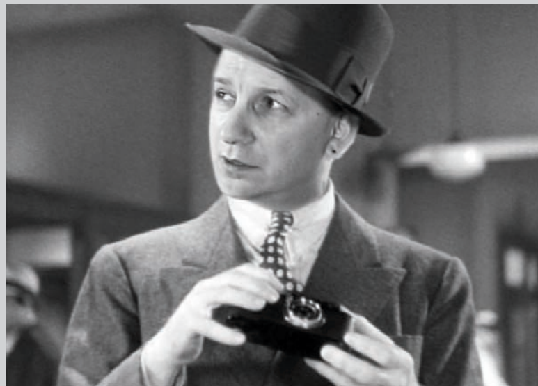
Chuck Samuels, Untitled , de la série Chuck Goes to the Movies , 2009, installation photographique, épreuves numériques, 108 photographies, 20,3 x 25,4 cm ch.

En fait, Samuels dévoile la profonde artificialité des deux médiums. En explorant la relation qu'il entretient avec l'image, il tente de comprendre la relation qu'il a entretenue avec son père. Mais ce faisant, il met les visiteurs de l'exposition devant leurs propres contradictions et