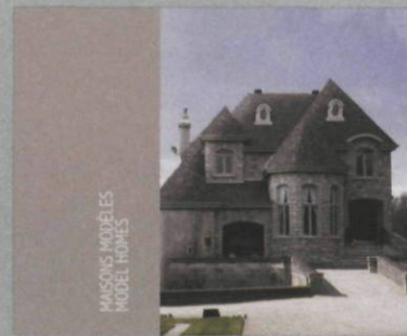
Isabelle Hayeur Maisons modèles / Model Homes Éditions Sagamie, 38 pages texte de Chris Balaschak, 11 reproductions couleur, 2008