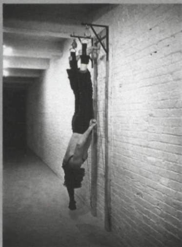
A Reading From the Lord's Prayer, 1979, image from the performance at Mercer Union