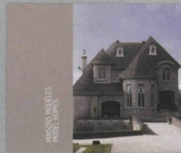
Isabelle Hayeur Maisons modèles / Model Homes Éditions Sagamie, 38 pages texte de Chris Balaschak, 11 reproductions couleur, 2008