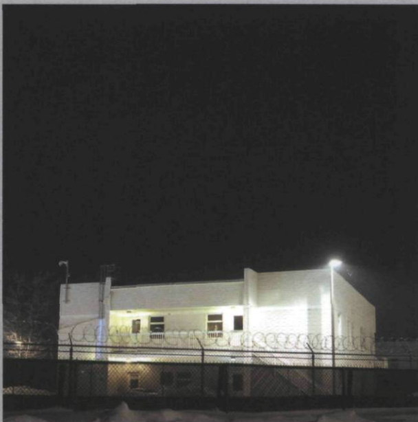
Prison de Joliette , 2008, C-prints, 88 x 85 cm.

Léonard based this meta-narrative on the Biblical story of the Annunciation. But you need not have been raised Catholic here in Quebec to appreciate the powerful dark undertow of this exceptionally moody