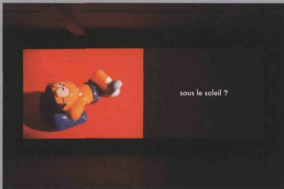
Le plan de la ville , 2006, installation vidéo, dimensions variable.

Cet enseignement dispensé par le temps, Henricks nous le décline à son tour à travers différentes métaphores – la ville, le corps, le bâtiment – qui elles-mêmes s'enchaînent. La ville prend la forme de cartes géographiques et de ruines romaines, de buildings et de graffitis. Ainsi, à la phrase